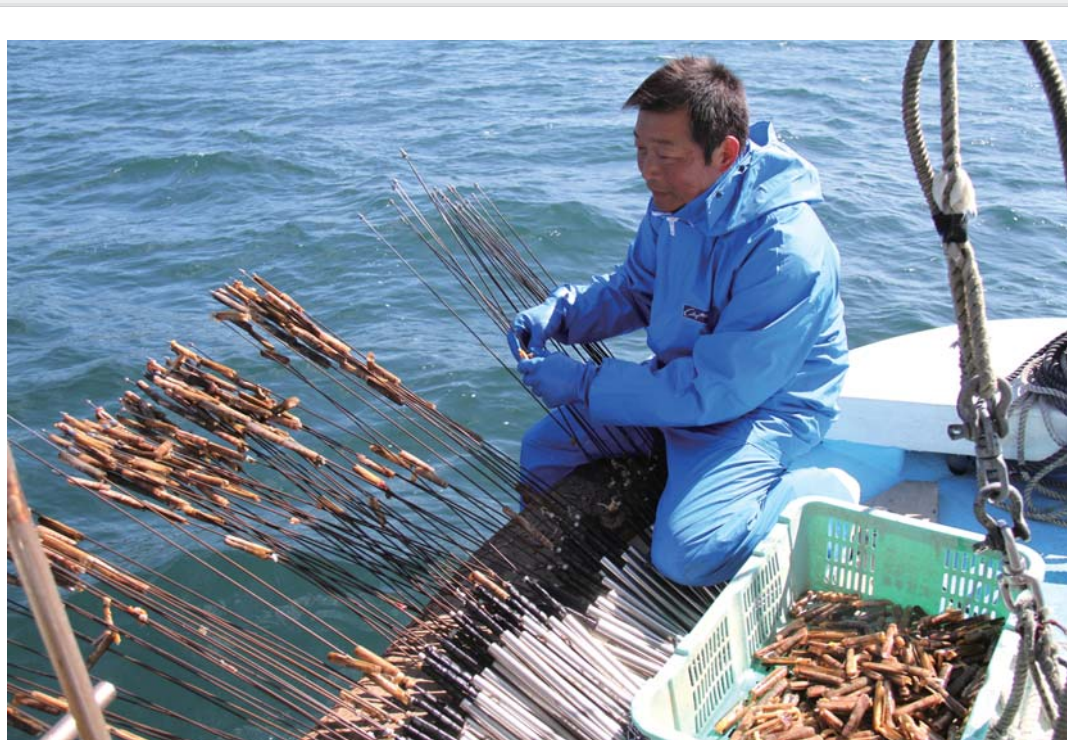
仕掛けで海底を突く作業をおよそ20分繰り返した後、引き上げる。写真はかぎ針にかかったマテ貝を取り外す様子