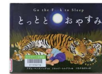
とつととおやすみ アダム・マンズバック 文 リカルド・コルテス 絵 つちやあきら 訳 (辰巳出版)

舞台は二十世紀初頭の東北。世の中の役に立つ人間でありたいと願っていた2人の少女は、山津波(土石流)が村を襲ったとき、幼子を守るため命の限り戦います。春の野に咲きたんぽぽの花のように、愛らしくて懐かしい物語です。