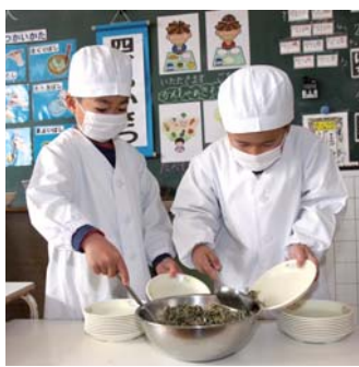
の提供を実施します。

本年9月から佐世保市学校給食センターを本格稼働することにより、市立全小・中学校において、安全でおいしい完全給食