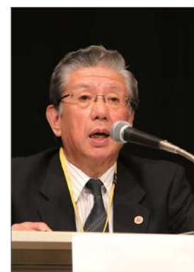
佐世保徳育推進会議 事務局長