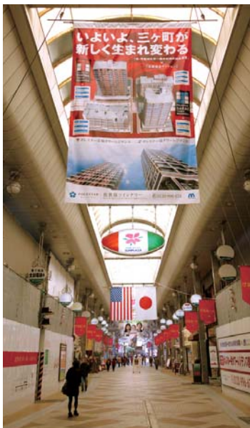
栄・常盤地区市街地再開発事業が進められている三ヶ町アーケード

交通不便地区対策については、地域と事業者と行政で支える「予約型乗合タクシー」を導入する地区の拡大を図るなど、交通不便地区の解消に努めます。