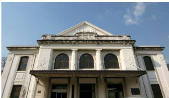
市民文化ホール(旧佐世保鎮守府凱旋記念館)

させるとともに、アニメキリンなど人気動物の導入を図り、ハード・ソフト両面から「また行きたい」と思っていただけける魅力ある動植物園づくりを推進します。