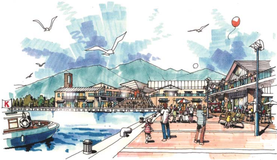
「(仮称)させほ五番街」の完成イメージ図

「東アジアへ向けた九州サブゲートウェイ構想」の一環である多目的国際ターミナル整備事業については、26年度の完成を目指し、外国人観光客の受け入れを行うターミナル施設や防災機能も併せ持つ耐震強化岸壁の整備を推進します。