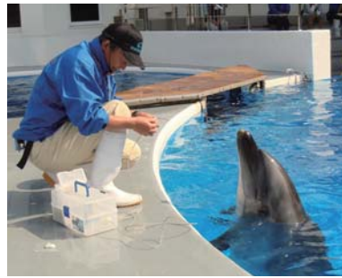
イルカ健康チェック

開館前の九十九島水族館「海きらら」に入り、バックヤードやイルカの朝の健康チェック、クラゲの朝ごはんの様子などを特別に見学できます。九十九島を船で巡るエコツアーもあります。