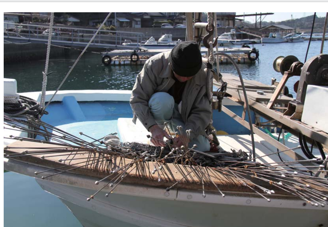
マテ貝漁の仕掛けを準備する様子。漁具は鉄工所の特注品で、先端は何度も海底の砂を突くうちに丸くすり減っていく