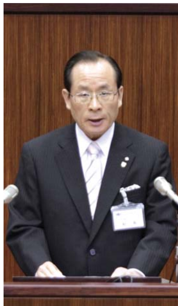
3月定例会市議会で施政方針演説を行う朝長市長

後期基本計画の「成長戦略」、「安全・安心なまち」、「地域の絆」という3つの重点プロジェクトと併せ、私は「美しいまち」「楽しいまち」「おいしいまち」の3つの「いい」のまちを市民