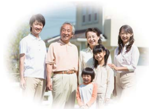
●健康づくり課(①~⑥) ●子ども保健課(⑦)