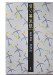
たんぽぽ そろし とこの 蒲公英草紙 常野物語 恩田 隆 著 (集英社)

舞台は二十世紀初頭の東北。世の中の役に立つ人間でありたいと願っていた2人の少女は、山津波(土石流)が村を襲ったとき、幼子を守るため命の限り戦います。春の野に咲きたんぽぽの花のように、愛らしくて懐かしい物語です。