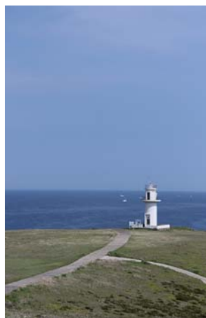
対馬瀬灯台(宇久島)

「ながさきしまとく通貨」とは、本市の宇久島をはじめ、長崎県内の各島で土産物や宿泊費などの支払いに使える、20%のプレミアム付き商品券です。5,000円で6,000円分の買い物ができますので、旅行などの際にご活用ください。