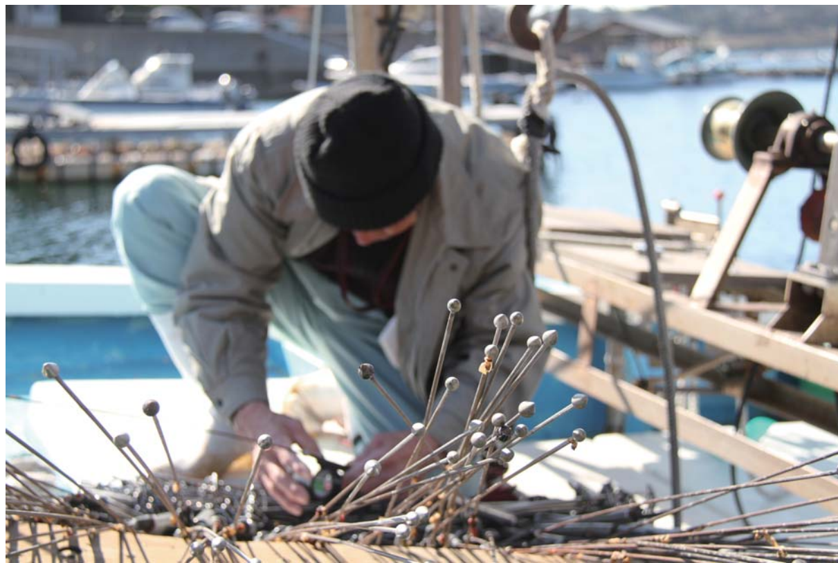
針尾瀬戸で行われる「マテ貝漁」の準備の様子。かぎ針が付いた仕掛けでマテ貝を突く漁法です

長串山公園 ☎77-4111 http://www.nagushiyama.jp