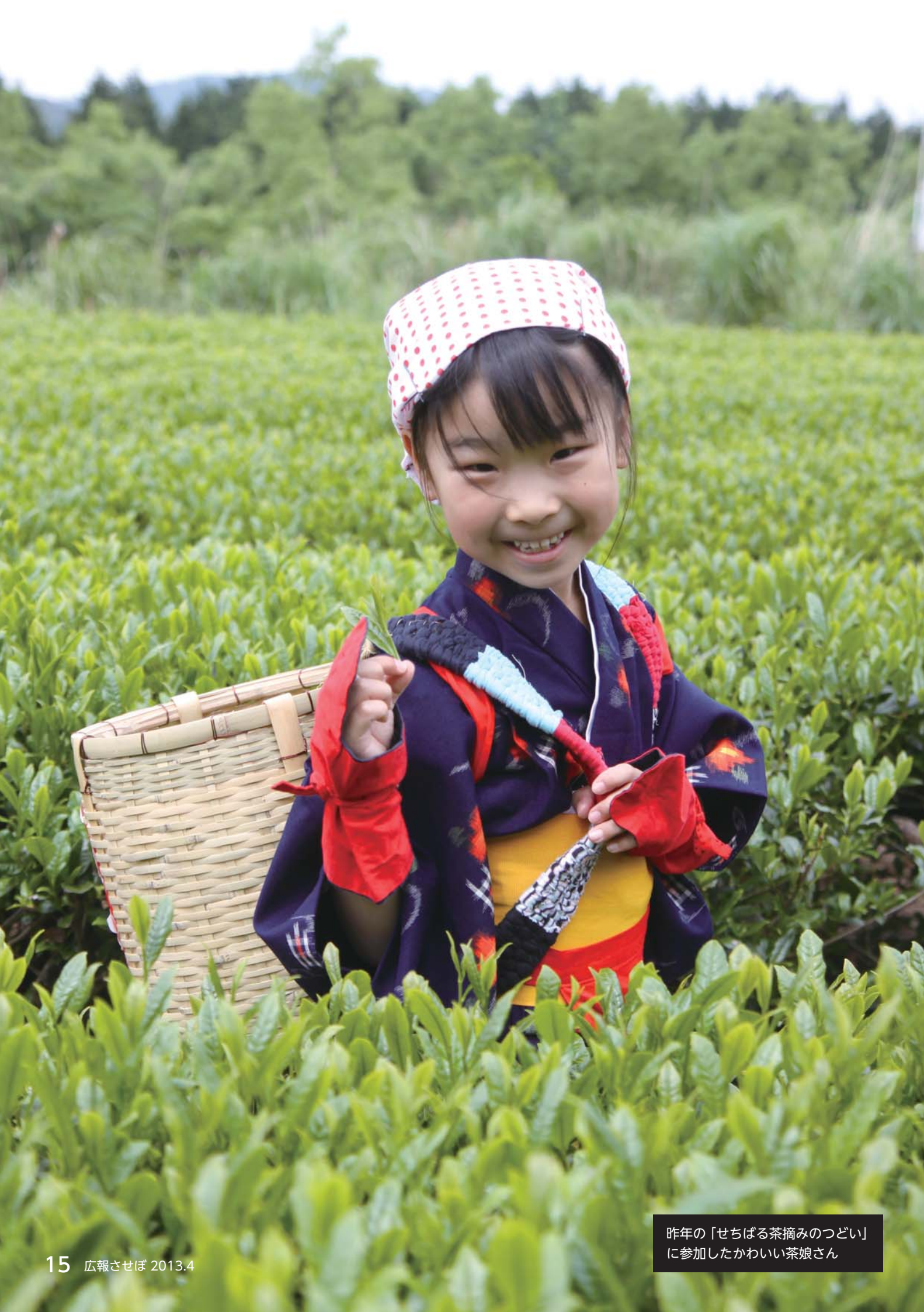
昨年の「せちばる茶摘みのつどい」に参加したかわいい茶娘さん