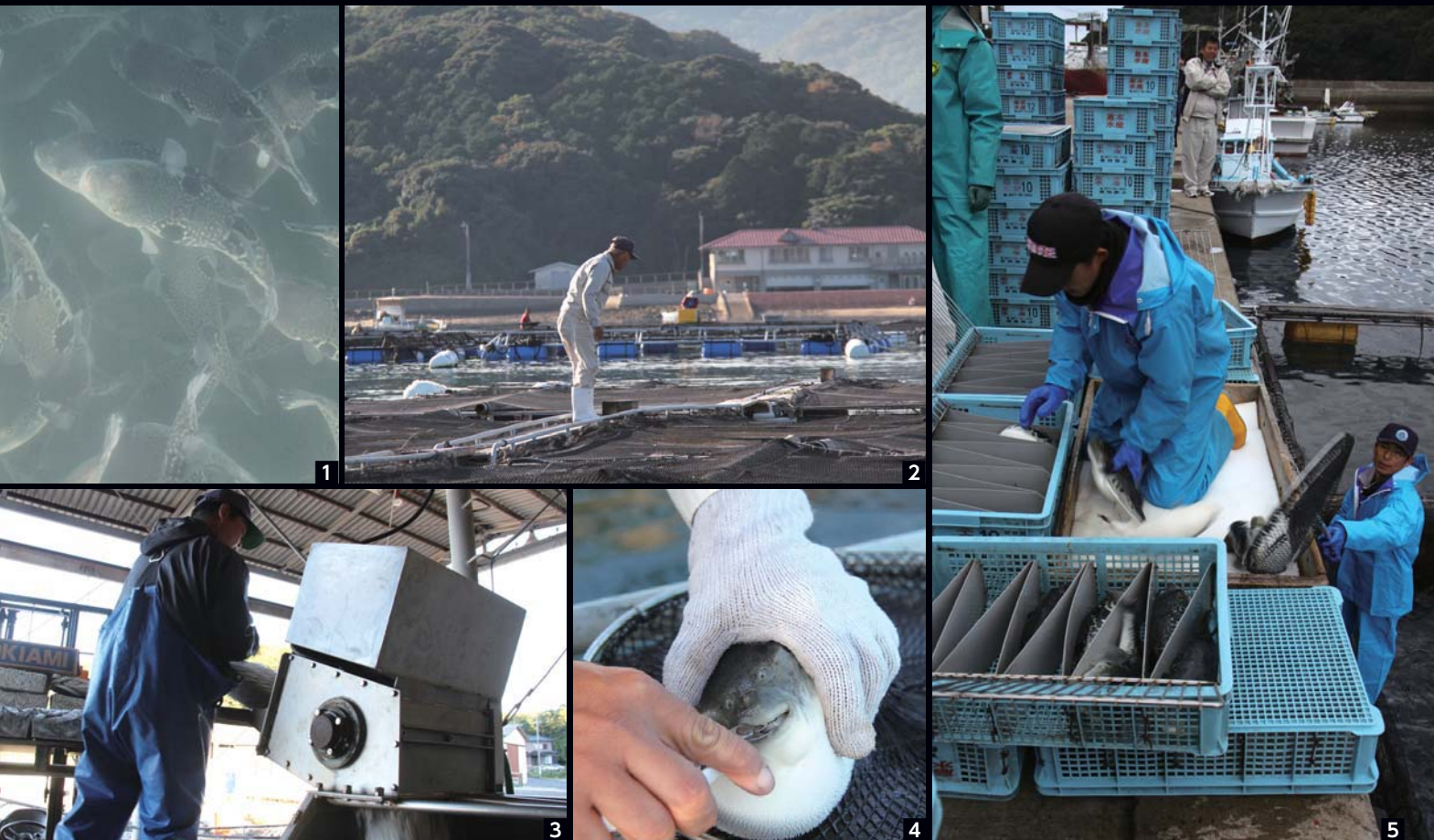
写真1 いかだの中で元気に泳ぎ回るトラフグ 2 餌やりやフグの健康状態のチェックは朝の日課 3 餌づくりの様子。各漁家が所有している機械で、オキアミやイカナゴなどを混ぜ合わせる 4 歯切りの様子。1匹1匹、鋭い歯を手作業で切っていく 5 水揚げされたトラフグは箱に詰められ、活魚輸送される。12月から1月にかけて出荷の最盛期を迎える