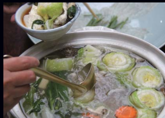
冬の味覚、てっちり(フグ鍋)。淡泊な身は旬の野菜とも相性よくなじみます