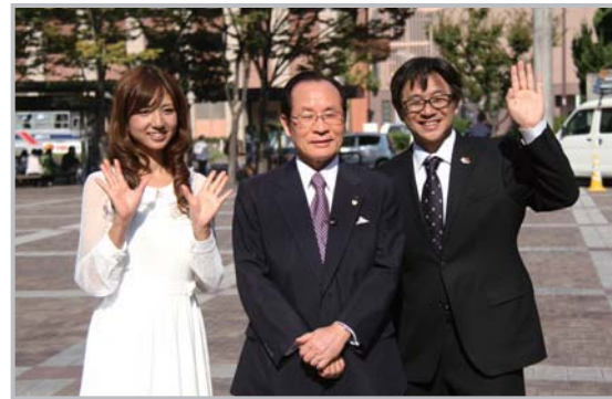
「佐世保市の出会い支援事業」(11月放送)の収録の様子。市ホームページで閲覧できます

佐世保の冬はイルミネーションやグルメを楽しむイベントがいっぱいあります。この季節だけの佐世保観光について朝長市長がお知らせします。