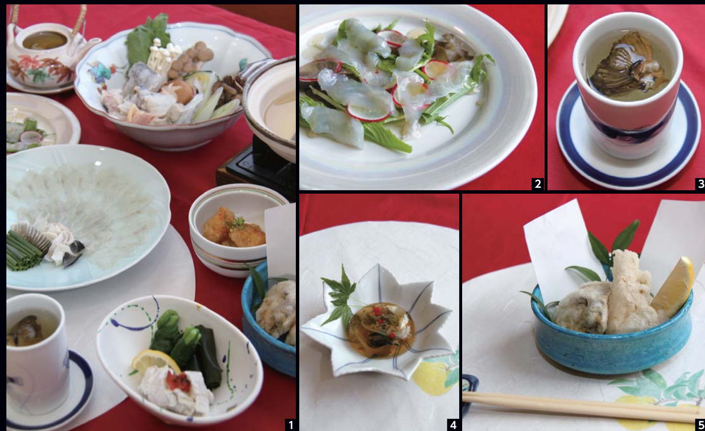
身欠きフグ1匹分の調理例(2人前・約700グラム)