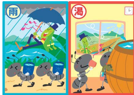
梅雨から夏の時季にできるだけ水を確保しておくことが、冬場の水運用には必要です

※次回は、佐世保市の水需要の特徴について説明します。 ☎水道局経営管理課 ☎24-1151