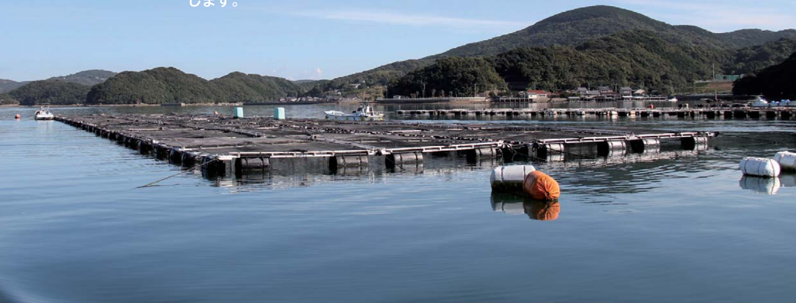
写真上：出荷を目前に控える鹿町産のトラフグ 写真下：養殖いかだが多く浮かぶ鹿町地域の港の様子

本市では「九十九島とらふぐ」として、地元にも愛される特産品に育て上げるため、関係者の皆さんと協力しながらブランド化に取り組んでいます。今回の特集では、九十九島とらふぐの養殖現場や地魚ブランド化へ向けた新たな動きについてお知らせします。