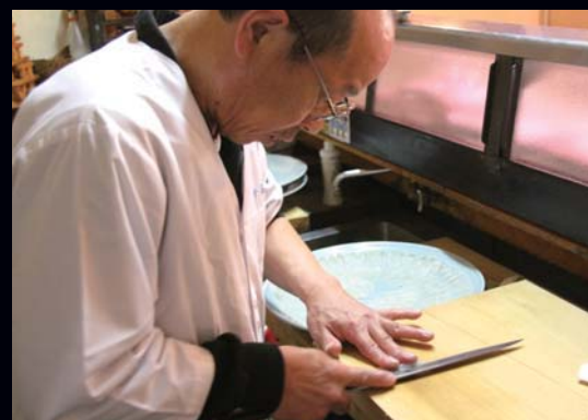
フグと言えばてっさ(フグの刺し身)。透き通るように薄く切るのが料理人の腕の見せ所