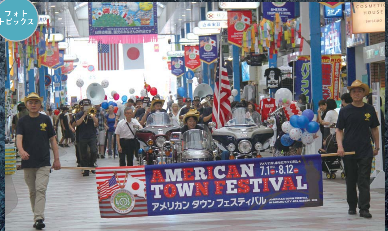
アーケードを練り歩き開幕を盛り上げたパレード