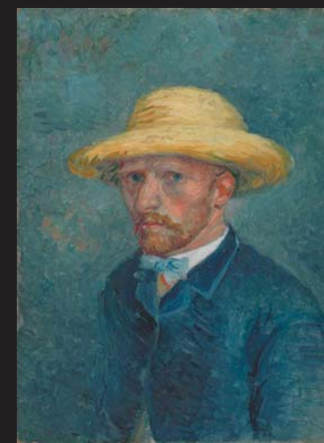
テオ・ファン・ゴッホの肖像 Vincent van Gogh (1853 - 1890) Portrait of Theo van Gogh, 1887 Paris oil on carton, 19.0 x 14.1 cm Van Gogh Museum, Amsterdam (Vincent van Gogh Foundation)

—パリ時代のゴッホ、空白の2年間— Van Gogh in Paris : New Perspectives