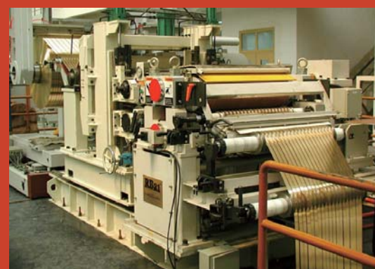
コイルセンターで帯状に切り分けられた金属板をコイル状に巻き直す工程の様子