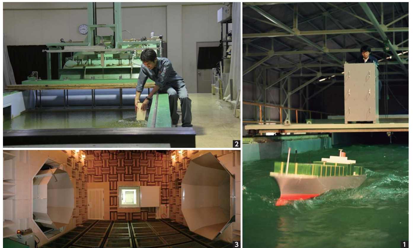
1 波や潮流、風を再現する海洋環境シミュレーション水槽は全長60メートルあります 2 舵周りの流れの様子を観察しているところ 3 九州大学工学部に納入した低騒音風洞。風速60m/秒まで再現できる