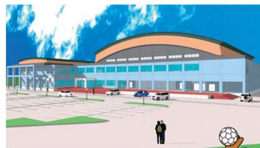
※新体育館外観イメージ図

体育館本体工事 平成24年6月～同25年7月中旬(予定) 外構工事・舗装工事 平成25年5月～同26年3月末(予定) 一般利用開始 平成26年4月1日から(予定)