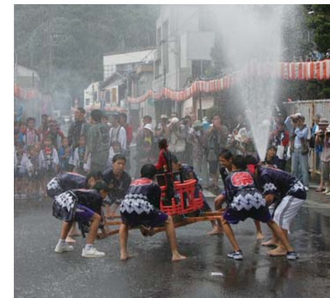
写真上左：こさざ夏まつり、右：江迎千灯籠まつり、下：昨年の水かけ地蔵まつり