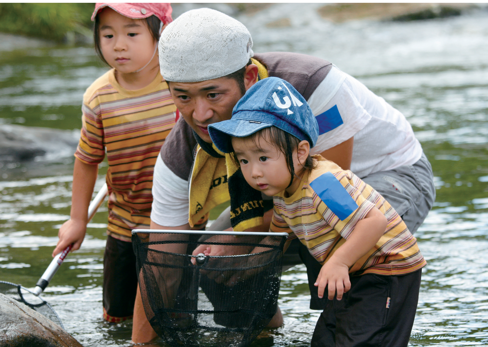
◎「あれ、な〜に?」。自然と触れ合う「川であそぼう!」に参加して、何かを見つけた親子連れ。(8月31日、上野原河川公園、環境保全課主催)