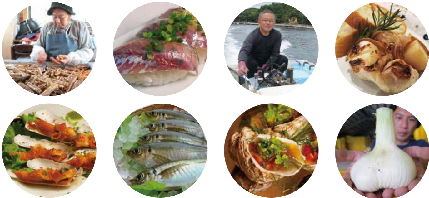
赤マテ貝 西海・瀬付き恵アジ 九十九島岩がき ジャンボニンニク