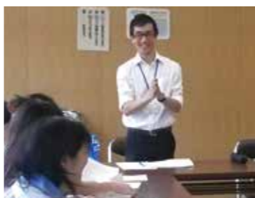
ホームステイ参加者に韓国の概要を説明する国際交流員