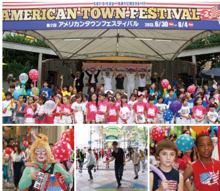
アメリカンタウンフェスティバル(6月30日@~8月4日@) 島瀬公園などで開催。初日のパレードを皮切りに、ステージやその周辺では毎週末イベントやバンド演奏が行われ、まちなかが大いにぎわいました。

佐世保のまちなかは、ことしもアメリカ色になりました。音楽、ダンス、食、そして身近な国際交流。2回目の開催となった「アメリカンタウンフェスティバル」には、たくさんの方が集い、笑顔であふれました。このまちながでは、夏の祭り、皆さんはどんな風を楽しみましたか？