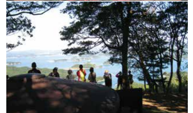
写真上：寿福寺(江迎町)、下：丸出山観測所跡(俵ヶ浦町)