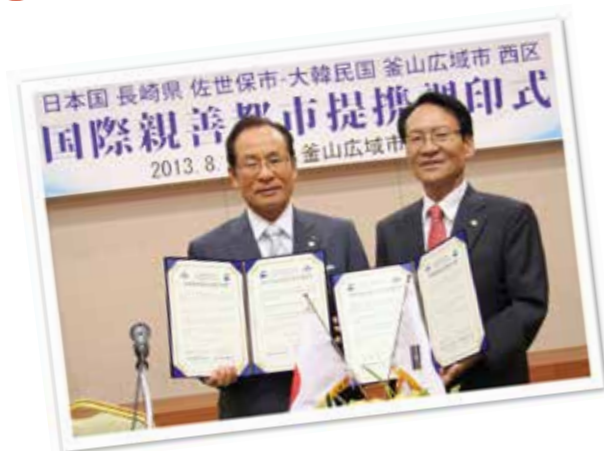
国際親善都市提携調印式で締結書を披露する朝長市長と朴区庁長