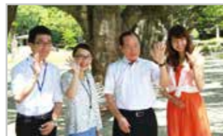
8月放送「佐世保市の国際交流」収録の様子。市ホームページで視聴できます。