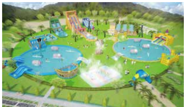
新しくなった「水の王国」