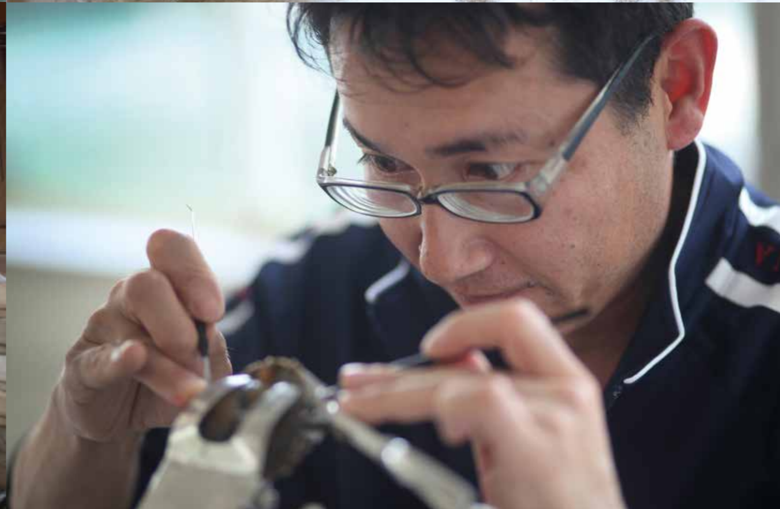
小佐々地域の九十九島いりこ加工場で働く皆さん。明るい職場で、仲の良い雰囲気などが伝わってきます。