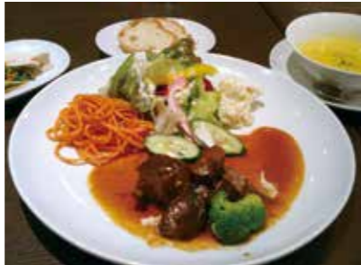
(上)新しくなった物販ゾーンの一部 (下)キトラス食堂で人気の「佐世保定食」。オープンの日にはビーフシチューがメイン料理でした。