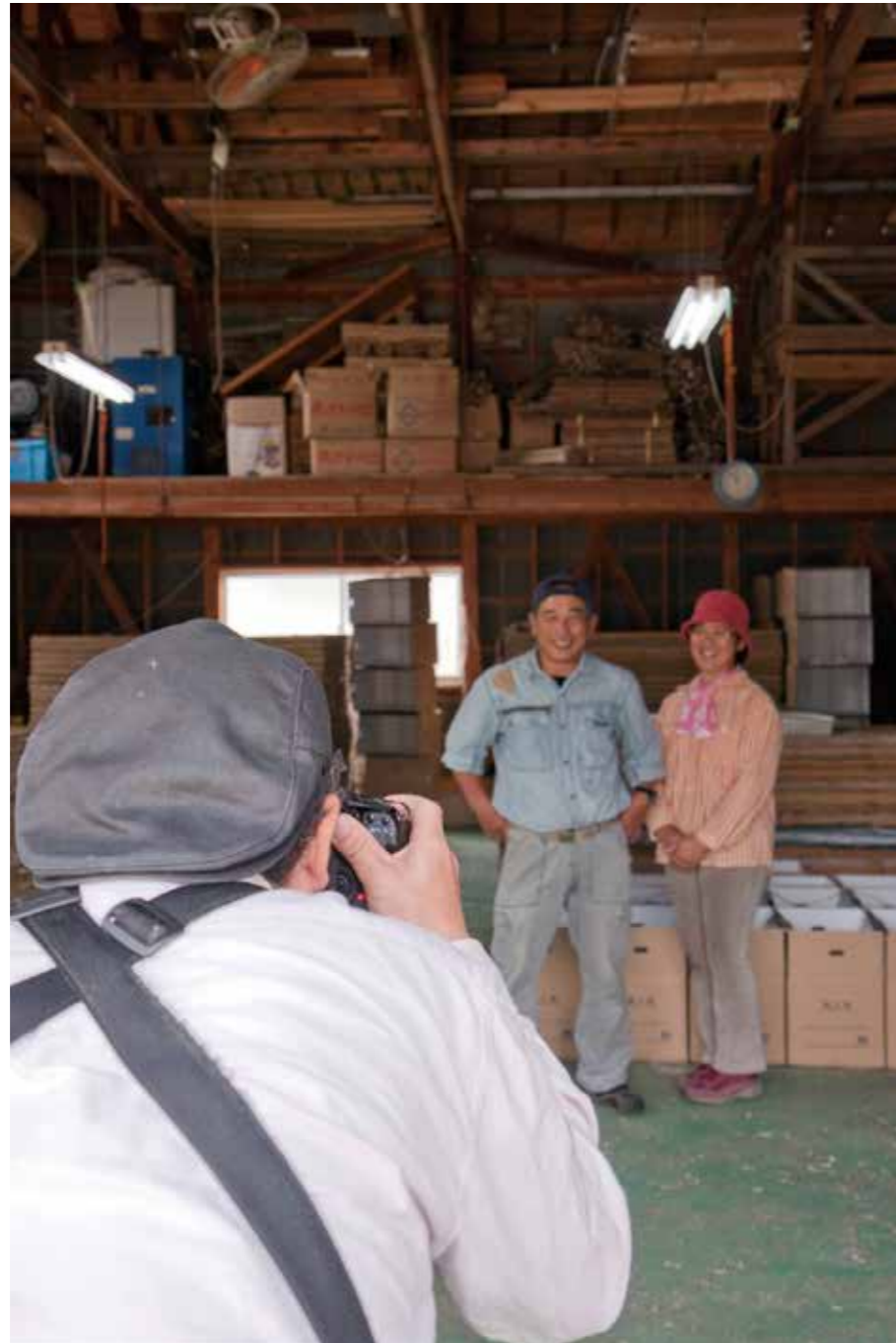
九十九島いりこの加工場での撮影風景

◎コンテストホームページ http://www.sasebo111.com ◎フェイスブックページ http://www.facebook.com/sasebo.111 問い合わせなど 観光物産振興局 ☎24-1111