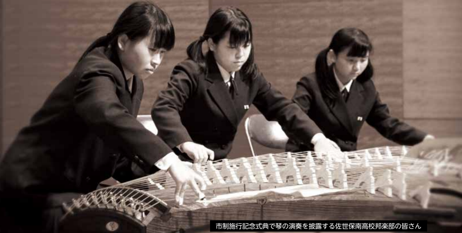
市制施行記念式典で琴の演奏を披露する佐世保南高校邦楽部の皆さん

文化活動に取り組む高校生が全国から集まり、吹奏楽など24部門の発表を行う「2013 長崎しおかぜ総文祭」が、今月31日(水)から始まります。このイベントの中から、本市で開催される部門の見どころをご紹介します。