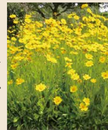
オオキンケイギク