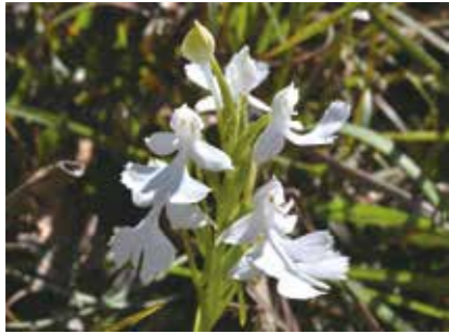
「ダイサギソウ」 絶滅の危険性が最も高い「絶滅危惧ⅠA類」に指定されている

市内に分布し、絶滅の恐れがある野生生物種を取りまとめた「佐世保市レッドリスト」。本市ではこのたび、市全域の最新の状況に基づき、掲載種やカテゴリーの見直しを行い、「2013年改訂版」を作成しました。市ホームページで閲覧できますので、どうぞご覧ください。