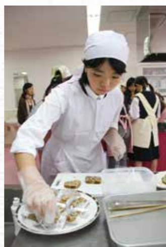
昨年度の最終審査の調理風景

11月2日(土)に行う最終審査の入選者10人には、地元の新鮮な食べ物の詰め合わせを進呈します。また1月に開催する「食育フェア」で入賞者(各部門最優秀賞1人、優秀賞2人)に賞状と記念品を贈呈します。