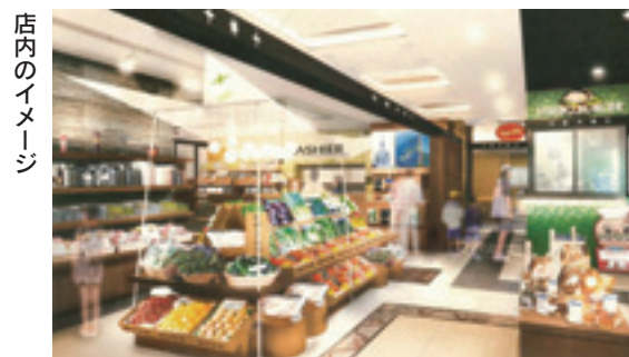
所在地:福岡市博多区上川端町(ふくぎん博多ビル1階)