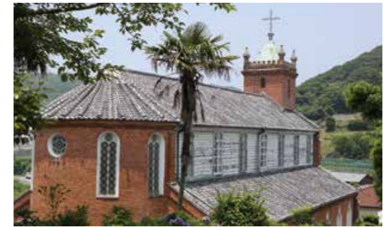
明治時代の建物でレンガ造りが大変美しい黒島天主堂。国の重要文化財にも指定されています

平成25年4月1日、本市と小値賀町は「海風の国」として、当時全国6カ所のうちの1つとして新観光圏の認定を受けました。「住んでよし、訪れてよし」の観光地域づくり、日本の顔となるブランド観光地づくりを目指して3年目を迎えています。