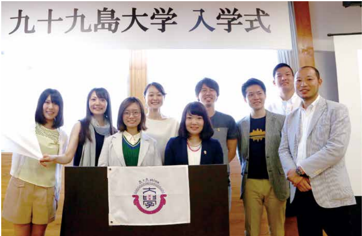
入学式に参加した九十九島大学の受講生の皆さん。第1回となった今回は5月30日～31日に九十九島の無人島体験や黒島での体験学習、ワークショップなどを行いました。