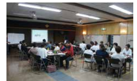
勉強会を行う黒島観光協会の皆さん

「海風の国」観光圏事業は本市や佐世保観光コンベンション協会が協力して支援に当たっています。黒島での取り組みは市内全地域にとってモデルとなる事業ですので、皆さんも注目してみてください。