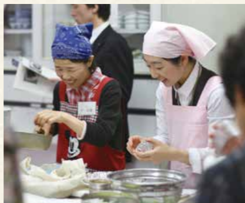
昨年度の最終審査の調理風景

申 7月1日(※)～9月10日(※)(必着)に、応募用紙(市役所、各支所、宇久行政センター、各地区公民館などで配布。市ホームページからもダウンロード可)に、一品料理(2人分)の材料、分量、作り方などを記入し、作品の写真を添えて健康づくり課へ。Eメール(kenkou@city.sasebo.lg.jp)での応募もできます。