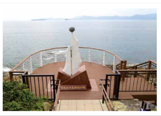
神崎鼻公園の展望デッキと本土最西端の碑