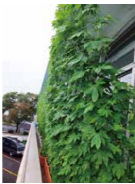
「みどりのカーテン」の写真

省エネ、地球温暖化防止の効果があり、地球にやさしい「みどりのカーテン」の写真を募集します。 ※啓発イベントなどで使用します。 対 市内の住宅・事業所でみどりのカーテンを育てた人 申 応募用紙に写真を添えて環境保全課へ ※9月30日必着 ※応募者には参加賞を贈呈します。 問 環境保全課 ☎26・1787