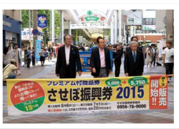
させば振興券販売初日の6月6日(土)に三ヶ町・四ヶ町アーケードで行われたパレード