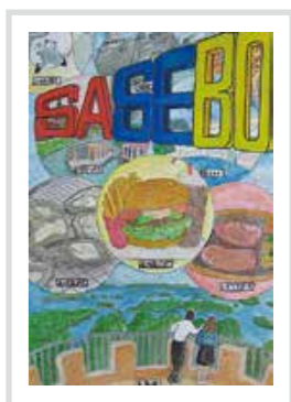
昨年度中学校部門 最優秀賞 問 観光物産振興局