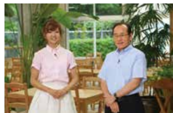
P 7月放送の様子。市Hから視聴できます