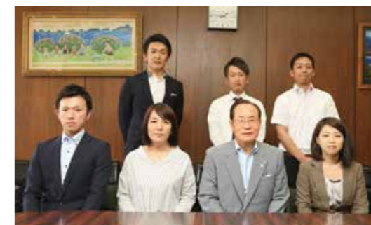
第15回の参加者の皆さん

※昼食は本市で準備します。 ※まちづくりのための意見交換の場です。要望・陳情の場ではありませんのでご了承ください。