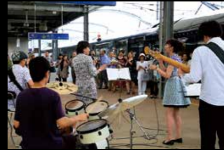
3月から「ななつ星 in 九州」をジャズの演奏等でお見送りしています（JR佐世保駅）