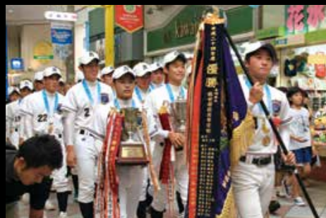
8月31日、全国高総体、全国高校定時制通信制体育大会での佐世保勢の全国制覇を記念したパレード

2015年は皆さんにとってどんな1年でしたか？本市では佐世保港に多くのクルーズ客船が寄港できるようになるなど、「常に進化し続ける佐世保」を象徴するような1年だったように思います。2015年のさまざまな出来事を広報写真で振り返ります。