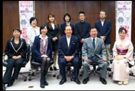
10月2日、キューピッド de 婚活サポート！ キューピッド役の認定式。皆さんの婚活をサポートします