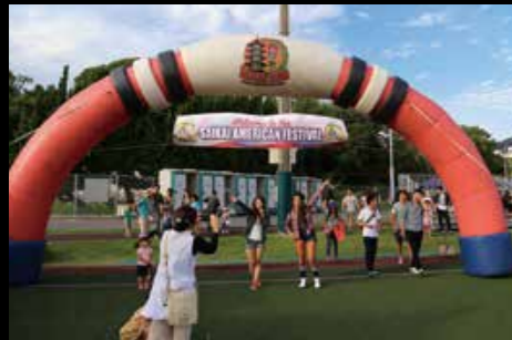
9月19～20日、13年ぶりに復活した「SAIKAIアメリカンフェスティバル」。多くの人出でにぎわいました