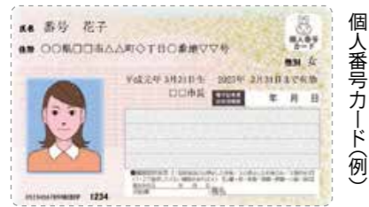
個人番号カード(例)

マイナンバー制度の開始に伴い、1月から社会保障、税など法令で定められた手続きを行うときにマイナンバーが必要となります。また、本市では、2月以降に希望者を対象に「個人番号カード」の交付が始まる予定です。個人番号カードはマイナンバーの確認書類としてだけでなく、公的な身分証明書にもなります。本市では、個人番号カードを利用して、コンビニエンスストアなどで住民票の写しや印鑑登録証明書、戸籍証明、所得課税証明書の交付が受けられるサービスも始まります。初回の発行手数料は無料ですので、この機会にぜひ個人番号カードを取得してください。