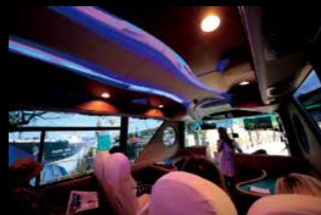
4月18日、クルーズバス「海風」が運行開始。ガイドの解説を聞きながら豪華なバスで市内を巡ります