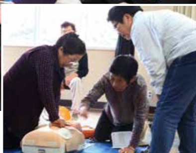
11月21日に開催された「ガイド養成講座」で救急救命講習を受講する皆さん。この日は15人が参加しました

まずは島を案内するガイドを増やそうと呼び掛けたところ、島の有志20人から応募があ