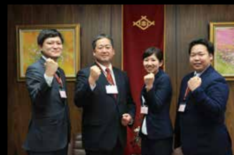
4月1日、「地域おこし協力隊」の委嘱状交付式。黒島と宇久島に住み、島の活性化に取り組んでいます