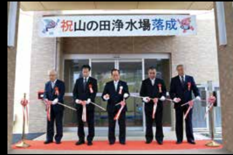
3月20日、山の田浄水場の落成式。旧山の田、旧大野浄水場を統合し、最新設備で4月から供用開始