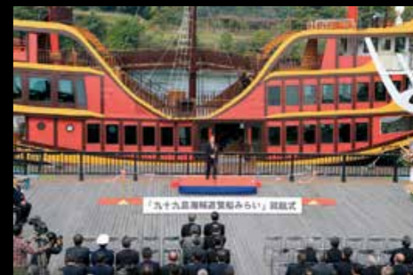
3月27日、九十九島海賊遊覧船みらいの就航式。日本初の電気推進遊覧船で自然に優しいエコな船です