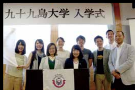
6月1日、「九十九島大学」の入学式。全国の若手クリエイターが九十九島の認知度向上に取り組みます