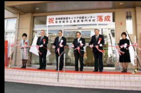
3月20日、市立看護専門学校、県看護キャリア支援センター落成式。学生の定員が40人から80人に倍増