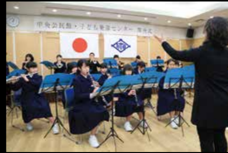
2月1日、中央公民館・子ども発達センターの開所式。地元中学生などによる演奏が式典に花を添えました