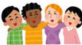
問 人権男女共同参画課

日本国憲法では「個人の尊重」がうたわれています。個人の尊重とは一人一人の違いを認め、一人一人を大事にすることです。多種多様な考え方やライフスタイルが存在する中、個人の多様性についての理解不足により、さまざまな人権問題が起こる場合があります。人種・国籍・宗教・性別・性的指向・年齢や障がいの有無など、一人一人の多様性を尊重することにより、人権が守られた豊かな社会の実現が近づくこととなります。