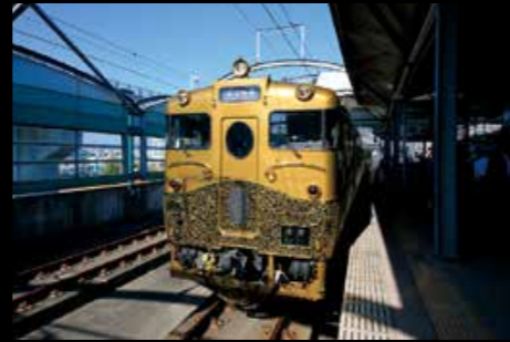
11月1日、JR九州の観光列車「或る列車」が佐世保―長崎間の運行を開始（金・土・日曜、祝日を中心に運行）