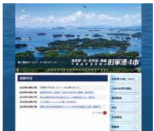
4市の近代化遺産や観光地などの情報を発信している旧軍港4市のホームページ

11月26日には、その活動の一環として「旧軍港四市・近代化遺産フォーラム」(旧軍港市振興