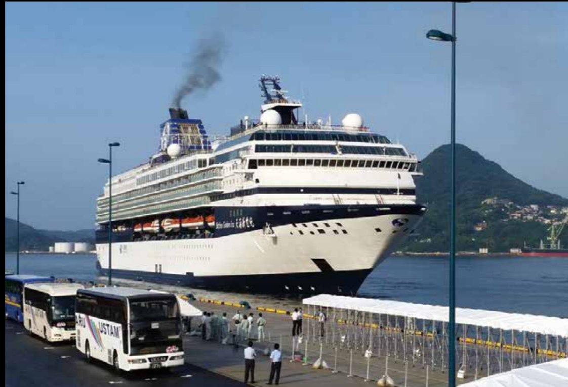
4月1日から佐世保港国際ターミナル「葉港テラス」が供用開始となり、延べ30隻を超える外国船籍クルーズ客船が寄港できるようになるなど、2015年は国際戦略を進める本市にとって大変意義深い1年となりました