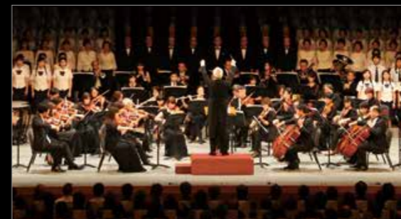
9月19日、西海国立公園指定60周年記念式典。約1,800人が参加し、西海讃歌の合唱などが披露されました