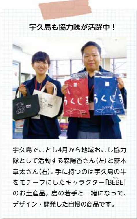
宇久島も協力隊が活躍中！

世界遺産登録を間近に控え、観光協会のサポートや土産品の開発など忙しい日々を送りながらも、島の人と協力しながら