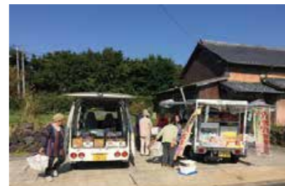
※現在、相浦・崎辺・北・西・九十九地区で実施しています。

少子高齢化や過疎化など社会情勢の変化に伴い、生活に必要な商店や交通機関の不足が問題となっています。行政だけで解決するのは難しい問題ですが、昨年11月から、1人暮らしの高齢者などの買い物をサポートする「移動スーパー」が地元事業者によって始まり、地域の人から好評を得ています。本市でも、住みやすい地域づくりを目指し、このような民間の取り組みを応援します。