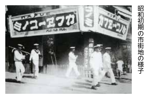
昭和初期の市街地の様子