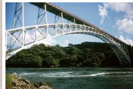
西海橋 (昭和30年、針尾東町) 戦後初の渡海橋で、径間長が200mを超えた日本初の長大橋。その後の長大橋建設の先駆けとなった「傑作」といわれています