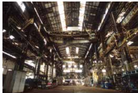
佐世保重工業(株)佐世保造船所組立工場 (旧佐世保海軍工廠造船部組立工場、大正8年、立神町) 外壁はレンガ造ですが、本体は鉄骨造。複雑な鉄骨の組み合わせにより迫力ある大空間が構成されています

鎮守府設置と時を同じくして鎮守府内に造船部が発足しました。後の「佐世保海軍工廠」です。専用のドックすら持たない状態で発足しましたが、年を追うごとに増強され、最先端の施設・設備が次々に導入されていきました。巡洋艦や駆逐艦、補助艦艇の建造と大型艦の改装を数多く手掛け、当時、世界最大と称された戦艦「武蔵」の建造にも携わりました。