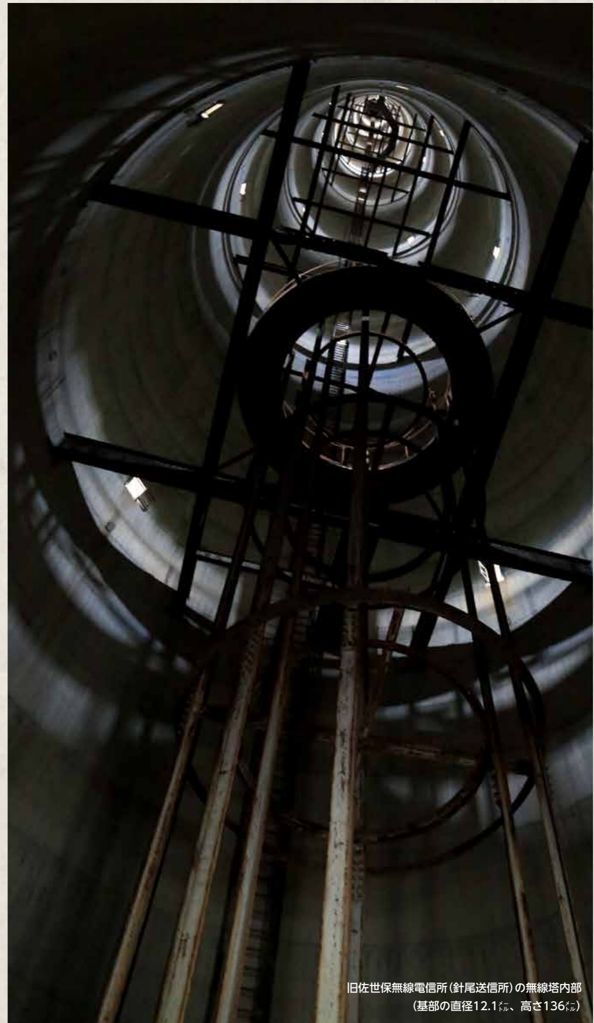
旧佐世保無線電信所(針尾送信所)の無線塔内部 (基部の直径12.1m、高さ136m)

本市に残る715件の近代化遺産。それらは本市が歩んできた歴史そのものと言えますが、ここではその歴史を7つの視点で振り返り、関連する14の施設等をご紹介します。