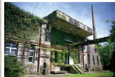
旧佐世保無線電信所電信室 (大正11年、針尾中町) 3基の電信棟の中央に位置し、右から発電機室、二次電池室、電信室と並んでいます。発電機室は天井高9mの大空間で、天井クレーンが残っています