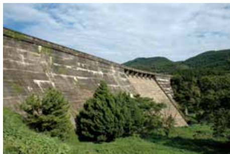
佐世保市水道局菰田貯水池堰堤 (昭和15年、菰田町) 市水道第四次拡張工事で完成した初めての市水道専用貯水池。この貯水池の完成でようやく海軍水道からの独立を果たしました