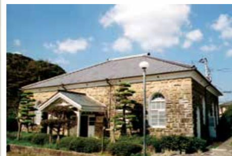
佐世保市世知原炭鉱資料館 (旧(株)松浦炭坑事務所、世知原町栗迎、大正元年) 昭和45年の炭鉱閉山まで事務所として使用されていました。県北地区で唯一の石造洋風建築となっています