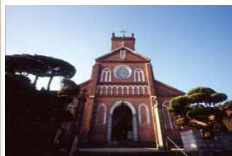
黒島天主堂 (黒島町、明治35年) フランス人のマルマン神父が設計し、島の信者総出で建設に当たりました。使われたレンガの総数は40万個に及ぶといわれています

近代化遺産というと、産業や軍事、交通に関するものという印象が強くなります。確かにそれらの数が多いのも事実ですが、その対象には、宗教施設や教育施設をはじめ、店舗や民家など、さまざまな民間施設も含まれており、本市においてもそれぞれの時代を反映したものが数多く残されています。