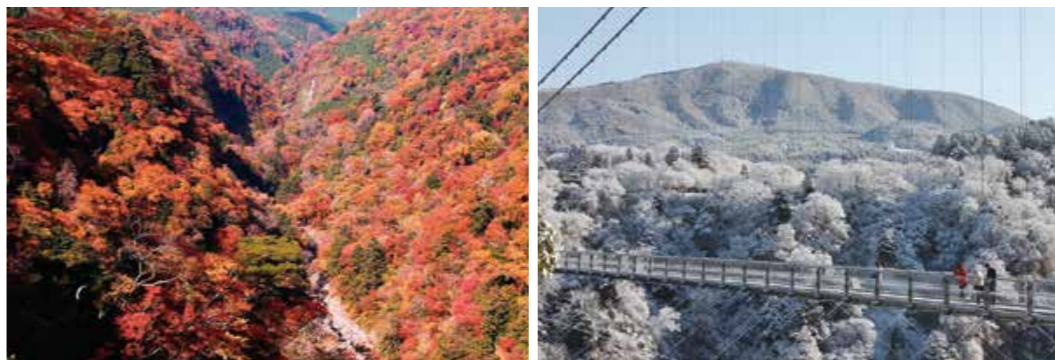
【右】長さ390mの九重夢大吊橋と雪景色【左】紅葉で色づく九酔溪(きゅうすいけい)