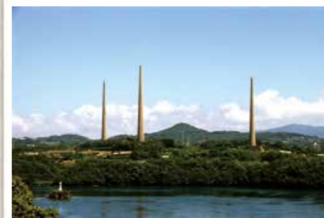
旧佐世保無線電信所(針尾送信所)施設 (大正11年、針尾中町) 日露戦争の教訓を基に、船橋(千葉県)、鳳山(台湾)と共に整備された長波通信施設。「ニイタカヤマノボレ」の発信については確証がありません

近世以前の通信手段といえば、飛脚で運ぶ手紙がほとんどでした。19世紀に電気信号で符号を送る電信が発明され、やがて声そのものを電気信号にして送る電話が発明されました。「新鮮な情報」は近代社会にとって必須であり、通信技術は飛躍的な進歩を遂げていきました。