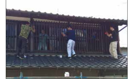
街並みの景観整備の様子

「海風の国」佐世保・小値賀観光圏の11のエリアのうち、「もてなしの時を重ね 心を束ねた 笑むかえ」をコンセプトに事業を展開している江迎エリアをご紹介します。