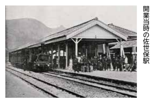
開業当時の佐世保駅