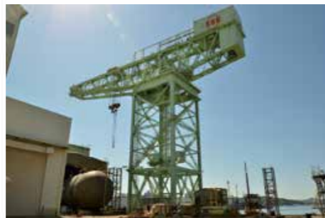
佐世保重工業(株)佐世保造船所250トンの起重機 (大正2年、立神町) イギリスのサー・ウィリアム・アロル社に発注されたジャイアント・カンチレバー・クレーン。日本に3台、世界にも11台しか残っていません