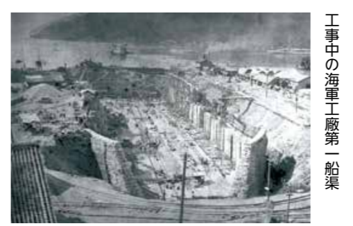
工事中の海軍工廠第一船渠