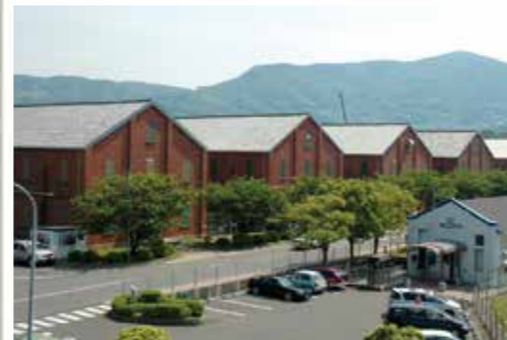
米海軍佐世保基地メインベース地区 (旧佐世保軍需部倉庫群、明治21～昭和11年、平瀬町) 明治37年までに11棟が建設され、主に食品や衣料品を保管しました。大正から昭和にかけて増築されています

明治16年、江戸時代の面影を色濃く残す佐世保湾に一隻の軍艦が入港。後にアドミラル・トーゴの名を世界に轟かせた東郷平八郎が指揮する「第二丁卯艦」で、その任務は日本の西域を守るための鎮守府と軍港の候補地を探すことでした。同年5月には、佐世保に軍港と鎮守府を設置することが正式に決定。近代佐世保の歩みは全てここから始まりました。