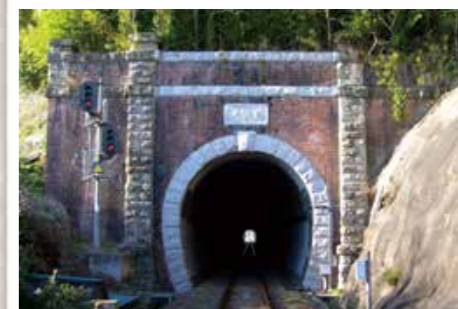
九州旅客鉄道(株)大村線南風崎トンネル (旧九州鉄道(株)第五号隧道、明治30年、南風崎町) 正面に見える石造りの柱は構造上というより意匠的なもの。この時期の建造物の特徴の一つになっています

明治5年に東京の新橋駅を起点とした鉄道は、同31年に佐世保まで到達。当時、煙を吐いて疾走する蒸気機関車は人々に近代化を強く印象付けるものでした。鉄道網とともに道路網の整備も進み、軍事物資や石炭の輸送に活躍しました。