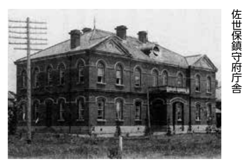
佐世保鎮守府庁舎