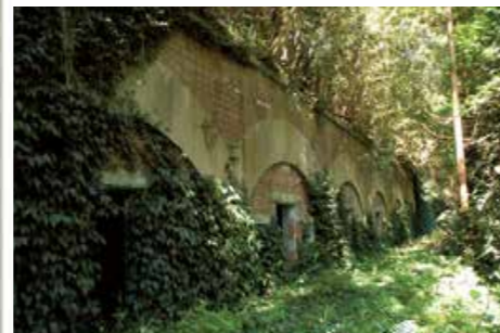
旧佐世保要塞小首砲台 (明治34年、俵ヶ浦町) 軍港防衛のために設立された陸軍佐世保要塞の7カ所の砲台の一つ。「24センチカノン砲」4門と「15センチカノン砲」2門を装備しました。写真は兵舎などに使われた施設