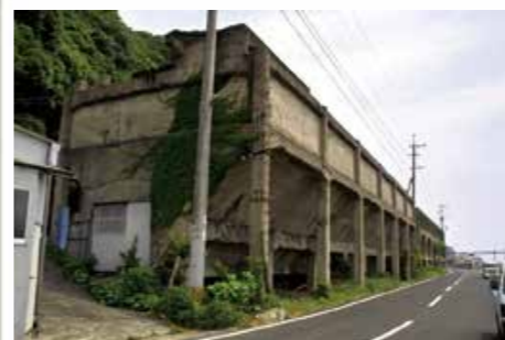
旧矢岳炭鉱石炭ポケット (昭和12年前後、小佐々町楠泊) 楠泊漁港の脇にあり、船積みする石炭を貯蔵していました。「ホッパー」とも呼ばれ、炭鉱を象徴する施設ですが、現存数は少なくなりつつあります

かつて「黒いダイヤ」と呼ばれ、日本の近代化を支える原動力となった「石炭」。佐世保市がある北松浦半島では、江戸時代の終わりごろから石炭の採掘が行われ、製塩の燃料などに使われていました。明治時代になると、より組織的で大規模に採掘が行われるようになり、佐世保炭田や北松炭田と呼ばれて活況を呈しました。