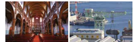
黒島天主堂の内部(左)とSSKの250トン起重機(右)