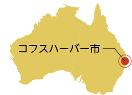
コフスハーバー市

人口約7万4000人の美しいまちです。オーストラリアの東海岸で、シドニーとブリスベンの中に位置しています。山と海が近く、緑豊かな山を下りると、すぐ雄大な太平洋の海岸線が広がっています。