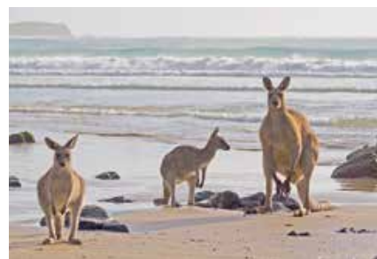
(左)豊かな自然に恵まれたコフスハーバーの市街地(上)野生のカンガルーに会える絶景のエメラルドビーチ

佐世保は私にとって特別なまちです。前回は初めての日本訪問だったのですが、佐世保を通じ、多くの日本文化を学ぶことができました。