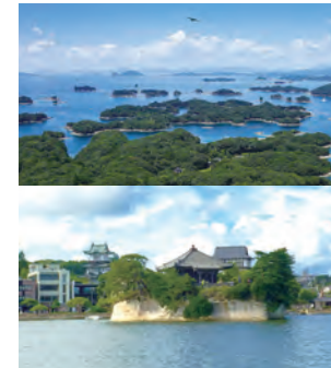
九十九島(上)と松島(下)の景観

れからは「三大松島」として連携を深めることで意見が一致しました。さらには、九十九島も「世界で最も美しい湾クラブ」に加盟するよう勧めいただきましたので、今後は協力を得ながら、九十九島が「世界の美しい湾」として認知されるよう、手続きを進めていきたいと思っています。市民の皆さんのご理解とご協力をよろしくお願いいたします。