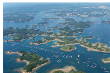
伊勢志摩国立公園

九十九島に代表される西海国立公園と伊勢志摩国立公園は、ともに多島海景観を特徴としていることから、昭和40年に姉妹提携を結びました。ことし伊勢志摩国立公園が指定70周年を迎えることを記念し、市長を団長とする市民ツアーを実施します。伊勢神宮や英虞湾など魅力いっぱいの伊勢志摩を巡ってみませんか。