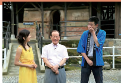
8月放送分の収録の様子。動画はパソコンやスマートフォンからも視聴できます。

佐世保の宝物「九十九島」。9月放送では、九十九島の日にちなんで開催される「たのしみマンス」や九十九島を巡る多彩なクルージングメニューなどについて朝長市長がお知らせします。