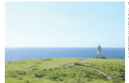
宇久島の風景(対馬瀬灯台)