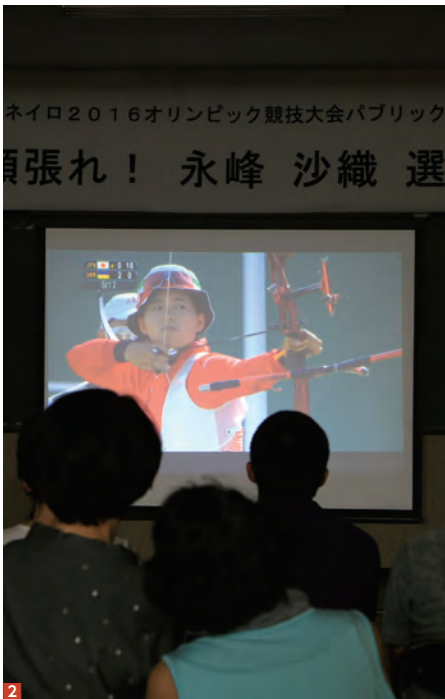
1 2 8月7日～8日(日本時間)に江迎地区公民館で行われたリオ五輪アーチェリー団体競技のパブリックビューイングの様子。永峰選手の家族や関係者、地元である江迎地域の皆さんなどが集まり声援を送りました 3 「第16回全日本中学生男子ソフトボール大会」において優勝を果たし、市役所に報告に訪れた長崎KSCの選手の皆さん