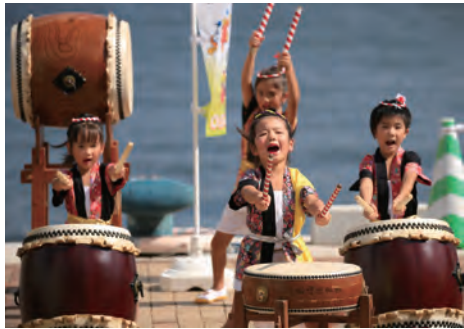
太鼓演奏で選手を応援する赤崎青い実幼稚園の園児(ねりんピック長崎2016佐世保市開催直前イベント、8月30日、させぼ五番街)