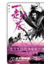
※デザインは昨年のものです。

12月8日(水)～11日(土)に開催される記念競輪のオリジナルQUOカード。全国のコンビニ、ファミリーレストラン、ドラッグストアなどで利用できる全国共通の商品券です。