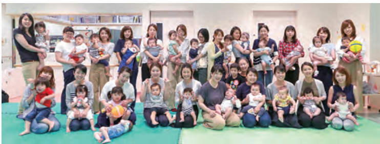
ひまわり 6月20日開催