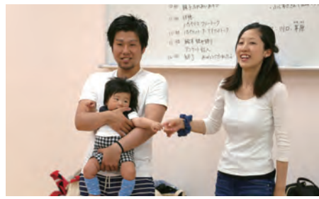
パパママ学級 5月28日開催