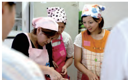
離乳食講座 5月30日開催