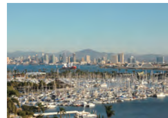
サンディエゴ港(イメージ)

問い合わせ締め切り日 9月1日(金) ※参加を希望される方には、旅行会社から詳しい参加条件を明記した書面をお渡しします。