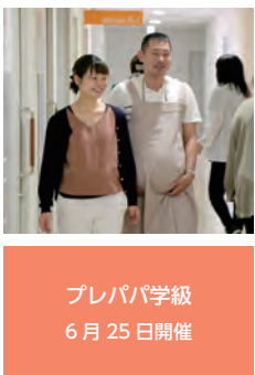
プレパパ学級 6月25日開催