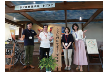
させば移住サポートプラザ 新港町8の1 ☎ 25・9251

充実や移住サポートプラザでの対応をはじめ、移住相談会への積極的な参加、移住応援ガイドブックやSNSなどの情報サイトを通じた「させば暮らし」の発信などによって、佐世保の住みやすさが広まった結果ではないかと思っています。