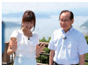
7月放送分の収録の様子

朝長市長が自らの市の施策などをお知らせする広報テレビ番組「させぼ市政だより〜キラっ都させぼ〜」。8月には「英語が話せるまち佐世保」をテーマにお知らせします。このほか、さまざまな分野で活躍する市民を紹介するコーナーや素敵なプレゼントも用意していますので、どうぞご覧ください。