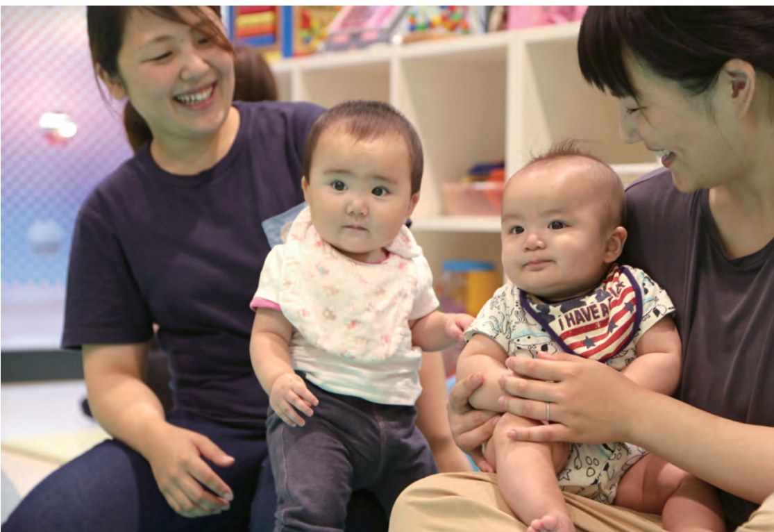
6月20日、乳幼児親子支援グループ「ひまわり」に参加した皆さん。親子遊びをしたり、お母さん同士で情報交換したりして、楽しい1日を過ごしました(5ページ)。