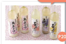
「あまざけパラエティ 6本セット」を プレゼント!

P8 イベント情報 P10 施設だより P12 定例市議会(重要事項の報告など) P13 佐世保市空家等対策計画 P14 市政通信(「佐世保市地域コミュニティ活性化に関する条例案」意見交換会、市職員採用試験など) P20 お便り、広報クイズ P21 住人百色、栄養士のおすすめレシピ P22 暮らしの情報 P26 健康と福祉 P30 市長日記、徳育通信 P31 シリーズ国際交流など