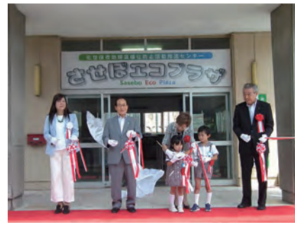
7月1日、開所式でテープカットを行った関係者の皆さん