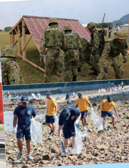
【左】熊本地震発生時に市民から寄せられた支援物資をヘリコプターに搬入する海上自衛隊の皆さん【右上】市総合防災訓練に参加する陸上自衛隊の皆さん【右下】市内の海岸で清掃ボランティアを行う米海軍佐世保基地の皆さん