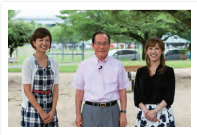
※8月放送分の収録の様子。