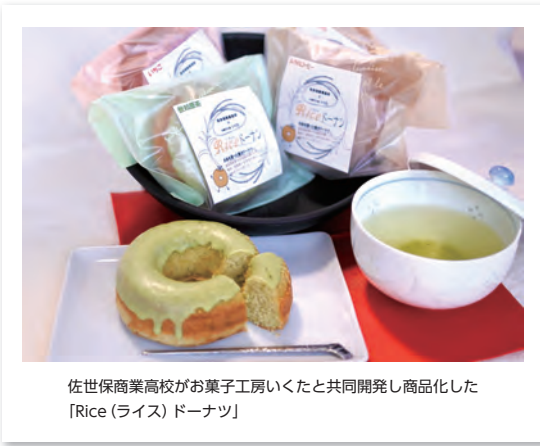
佐世保商業高校がお菓子工房いくと共同開発し商品化した「Rice(ライス)ドーナツ」

日程 9月23日(土)、24日(日) 10時～16時 場所 島瀬公園 内容 世知原茶、佐々茶、松浦茶の逸品茶の試飲販売、世知原茶を使ったお菓子の販売(お茶のご、世知原茶豆乳、まごころぼるとなど)、全国お茶まつりに向けにお菓子店などで商品開発中の試作品の試食会、佐世保商業高校による「SASHO-Cafe」の開催 など