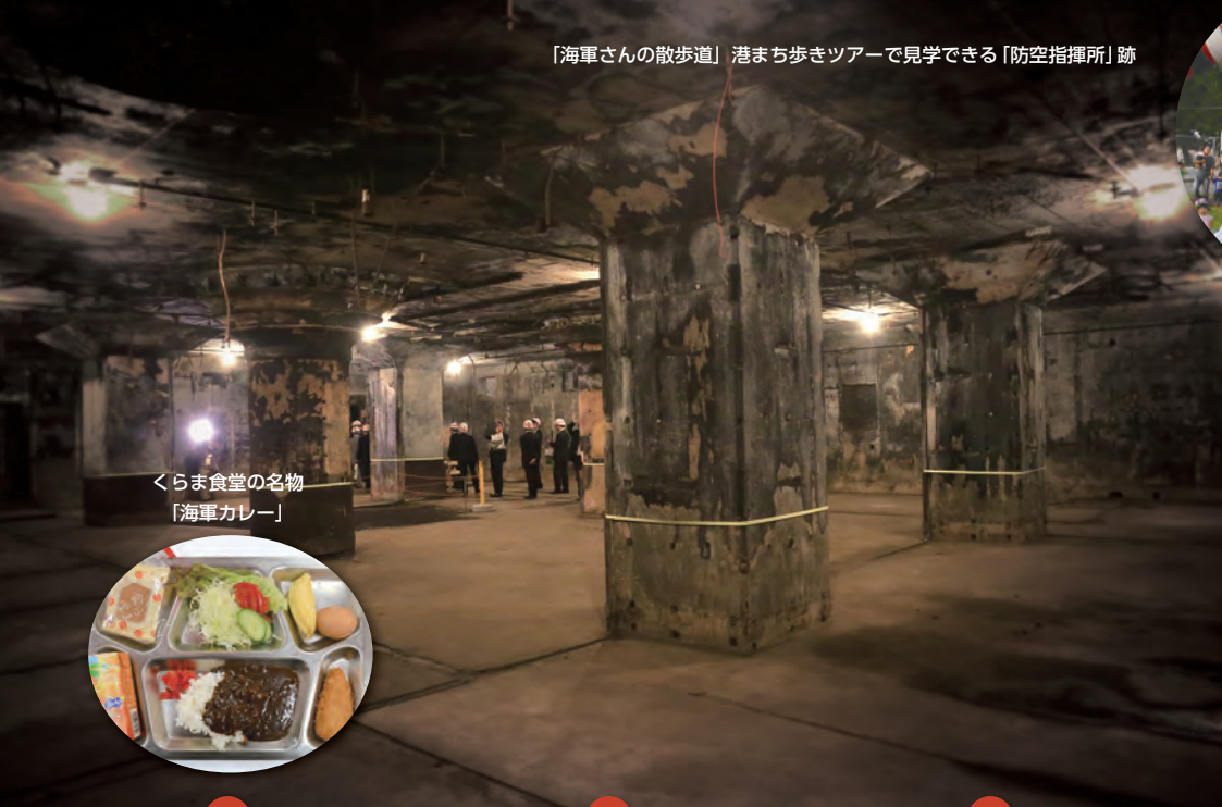
くらま食堂の名物 「海軍カレー」