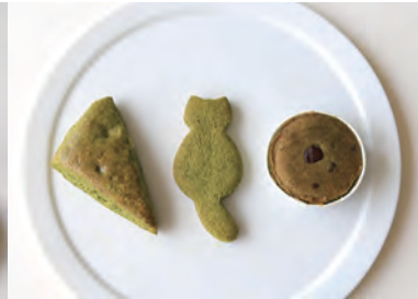
緑茶スコーン、お茶つきー Sweets&School えがお(早岐 2-16-13)

かわいいサイズの「ぼると」です。ビスケットの甘さに負けない、お茶の風味を生かした商品です。 価格 540円(6個入) 販売店 白十字パーラー本島本店、京町支店、道の駅させぼくす 99 など