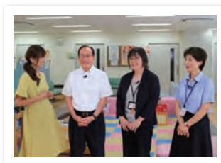
※9月分の収録の様子。