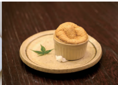
世知原茶スフレ つみきばこ(島地町 6-3)

佐世保商業高校商業クラブと道の駅させぼくす 99、前田製茶が共同開発して商品化したプリンです。同梱のきな粉をかけて食べる和風感覚のプリンで、甘さ控えめな大人の味です。 価格 300円 販売店 道の駅させぼくす 99 など