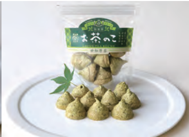
お茶のこ 草加家(重尾町 210)