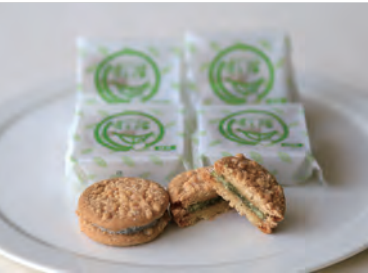
まごコロポルト(緑茶) ぼると総本舗(本島町 4-19)

今回、お茶まつりを盛り上げていただくため、地元の菓子店や飲食店などにご協力をいただき、世知原茶を使った新商品が数多く誕生しました。ここでお知らせするもの以外にもたくさんのお茶まつり会場でも販売されますので、おいしいお茶と一緒にお召し上がりください。