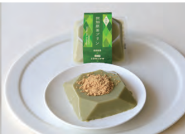
世知原茶プリン 道の駅させぼくす 99(愛宕町 11)

佐世保名物の甘い豆乳に世知原茶を混ぜた豆乳です。写真の茶そば弁当のほか、うどんや冷麺もあります。 価格 世知原茶緑茶豆乳(2本入) 171円 茶そば弁当 158円 販売店 まつばや、フルノストア、ララコープ、佐世保玉屋、四季彩館など