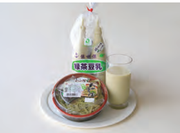
世知原茶豆乳、茶そば弁当 朝日食品工業(万徳町 2-2)

生地にお茶を練り込みました。ヘルシーでお茶の風味を感じるやさしい味です。 価格 緑茶スコーン 140円～、お茶つきー 194円～、お茶パウンドケーキ 270円 販売店 Sweets&School えがお、温泉のパン屋さん「パンのかをり」など