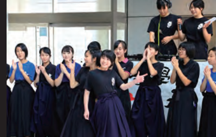
文化マンスのオープニングを飾った「高校生書道パフォーマンス」