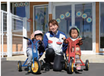
工場と同じ敷地内に開園した「わかば保育園」

自動車内装部品の製造メーカー 双葉産業 株式会社 長崎工場 所在地 小佐々町葛籠278の1 操業開始時期 平成28年3月 本社 大阪府箕面市