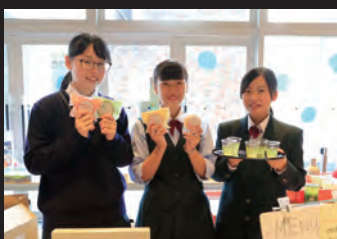
地元の食材を使用し独自に開発したお菓子などを高校生が販売するコーナー