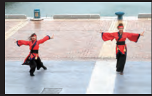
日程が選挙と重なったため踊り子がそろわず、急ぎよ2人で参加したチームの演舞。堂々とした踊りに大きな拍手が送られ「ありがとう」の声が掛けられました。

全国から参加していただいた踊り子の皆さん、運営を手伝っていただいたボランティアの皆さん、手拍子、足拍子で応援していただいた市民の皆さん、そして、いつも1年がかりで準備をしていただいている実行委員会の皆さん、ありがとうございました。