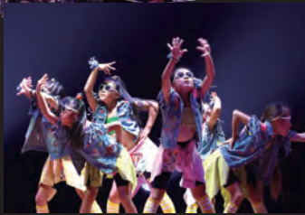
市内の数多くのダンスユニットが参加したダンスフェスティバル