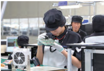
製造した基板を検査する九州テンの従業員

無線通信機器・各種車載器製造メーカー 株式会社 九州テン 所在地 小佐々町葛籠278の18 操業開始時期 平成29年1月 本店所在地も同上