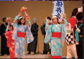
豊作祈願や祈禱のため江戸時代から江迎長坂地区で継承されてきた「長坂浮立」