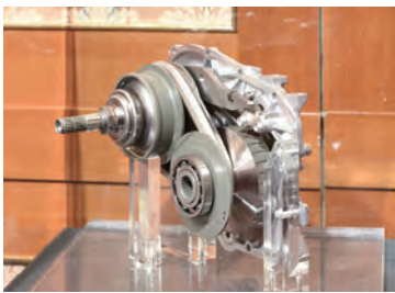
シーヴィテック九州が製造するCVT金属ベルト

国内唯一の自動車用無段変速機（CVT）ベルト専門メーカー 株式会社 シーヴィテック九州 所在地 小佐々町黒石332の1 生産開始時期 平成28年12月 本社 愛知県田原市