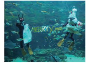
海きりぎりす限定ダイバー

九十九島パールシーリゾート 〒858-0922 鹿子前町1008 ☎28-4187