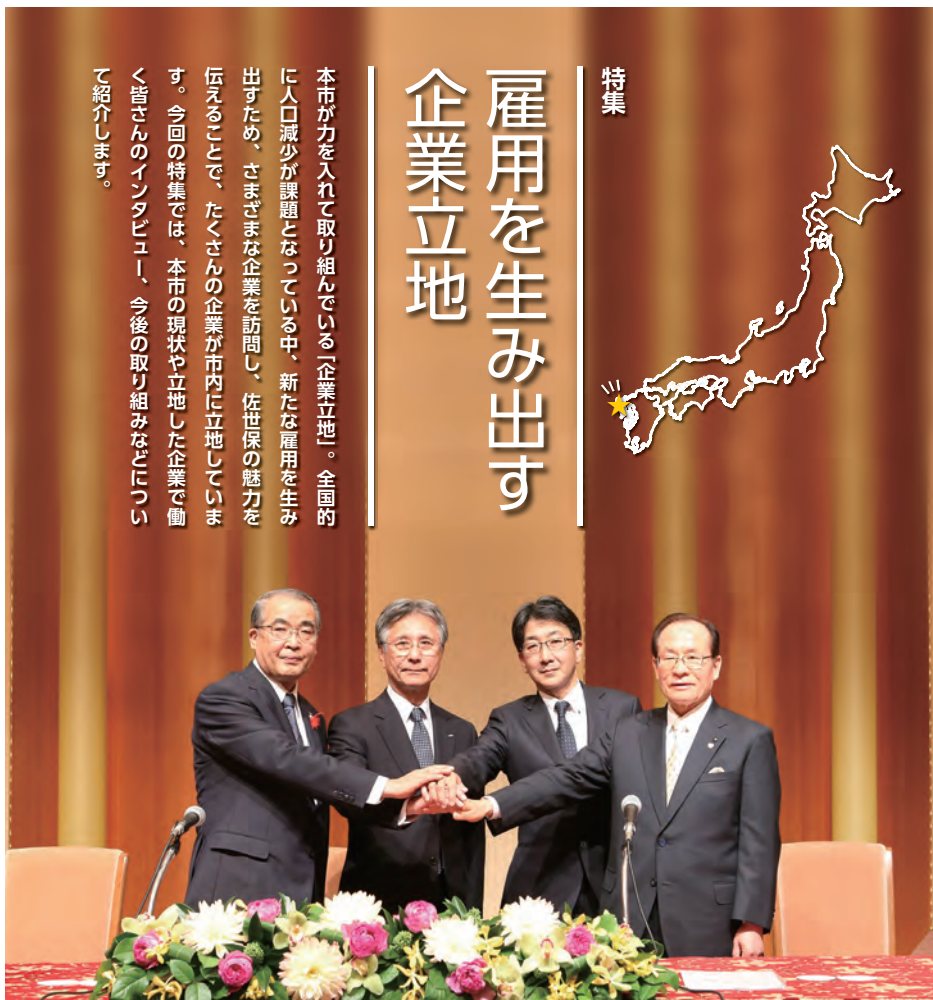
シーヴィテック九州との立地協定調印式(平成26年11月)

本市が力を入れて取り組んでいる「企業立地」。全国的に人口減少が課題となっている中、新たな雇用を生み出すため、さまざまな企業を訪問し、佐世保の魅力を伝えることで、たくさん企業が市内に立地しています。今回の特集では、本市の現状や立地した企業で働く皆さんのインタビュー、今後の取り組みなどについて紹介します。