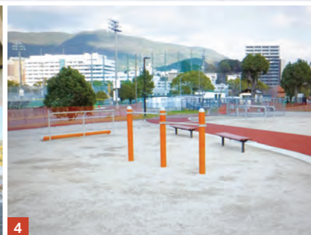
1,2,3 オープニングイベントでスケートボードや自転車BMX、3on3(3人制バスケットボール)を楽しむ皆さん 4 健康遊具エリアの一部