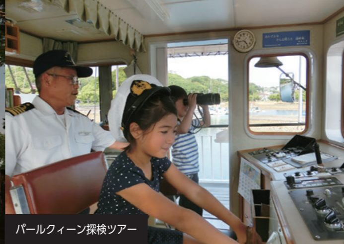
パールウィーン探検ツアー