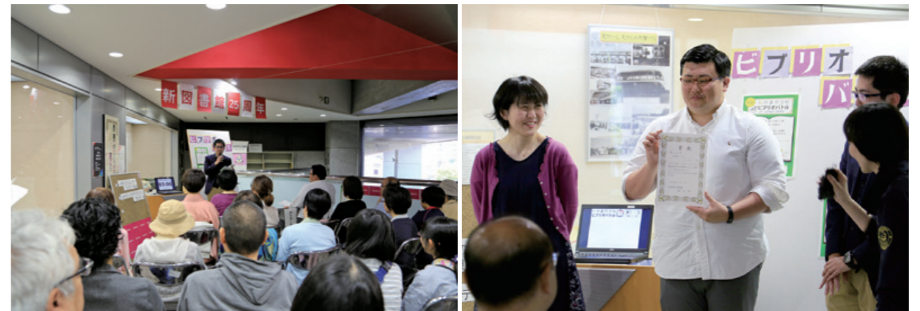
5月4日、「図書館まつり」で開催された第13回ビブリオバトルの様子。3人のバトラーがおすすめの本を持ち寄り、手に取ったきっかけや印象に残ったシーンなどを参加者にアピールしました。