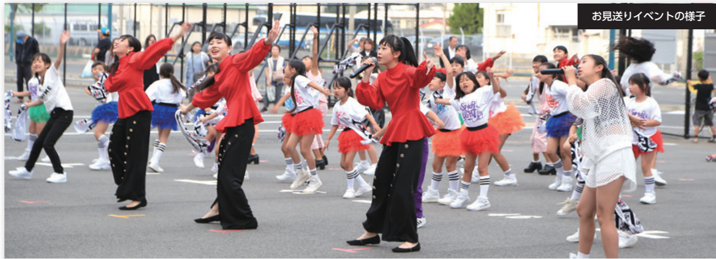
お見送りイベントの様子