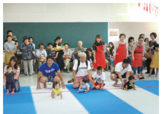
「赤ちゃんハイハイ・ヨチヨチ歩き大会」に参加する中部地区の皆さん

今後の抱負について尋ねると「これからもまちづくりの活動を継続し、このまちに住んで良かったと思ってもらえるようにしていきたい」と思い、笑顔で語っていただきました。