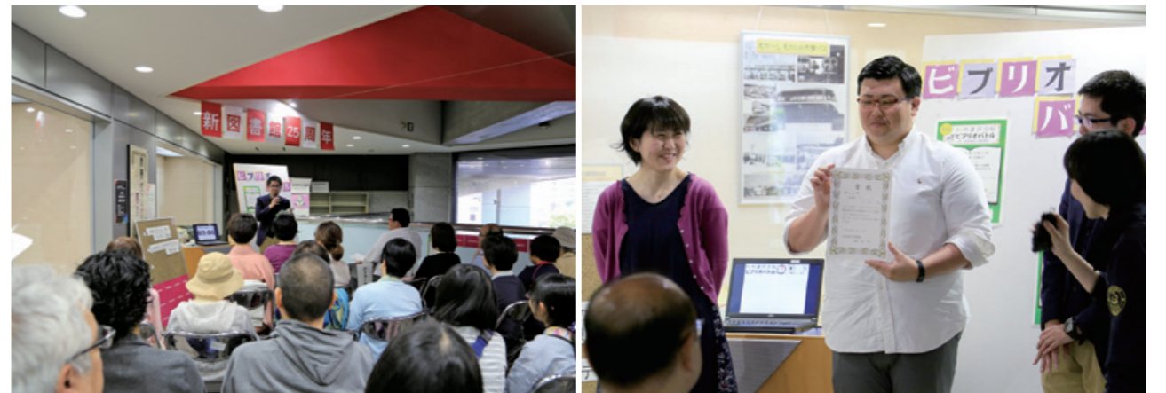
5月4日、「図書館まつり」で開催された第13回ビブリオバトルの様子。3人のバトラーがおすすめの本を持ち寄り、手に取ったきっかけや印象に残ったシーンなどを参加者にアピールしました。