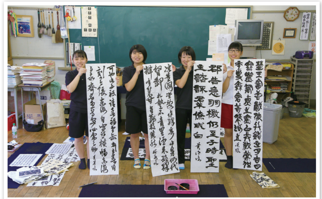
楽園祭に出演する西海学園高校・書道部の皆さん。本番に向け、毎日練習に励んでいます

佐世保の文化に親しむ月間「させば文化マンス」。本市では文化を担う人や文化に触れる人を大きく育てていこうと毎年 11 月を文化の強化月間としています。第 8 回となる今回もメインプログラムである「楽園祭」(11月16日、17日)を中心に市内各所で多種多様なイベントが開催されますので、今回の特集ではその概要についてお知らせします。年に 1 度の佐世保の文化の祭典ですので、市民の皆さんもどうぞ参加ください。