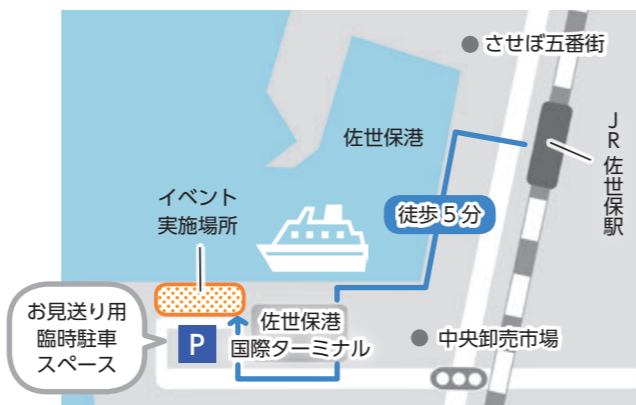
国際ターミナルへのアクセス

①クルーズ船寄港関係 みなと振興・管理課 ☎22-6127 ②お見送りイベントなど 観光課 ☎24-1111