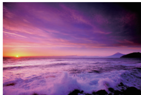
伊豆市八木沢海岸

※★印は佐世保港初寄港のクルーズ船。 18時までに出港予定の場合は出港の約30分前からお見送りイベントを実施します。車で来場する場合は出港の約30分前から接岸場所付近に駐車できますので、交通整理員の案内に従ってご来場ください。 ☎クルーズ船寄港関係 みなと振興・管理課 ☎22-6127 ☎お見送りイベントなど 観光課 ☎24-1111