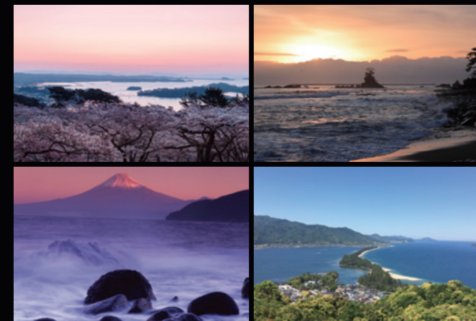
上段左から松島湾、富山湾、下段左から駿河湾、宮津湾・伊根湾