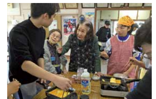
多世代交流イベントで卵焼きの作り方を教わる中学生

多世代交流で大切なことは「他人を認めること、尊重すること」だと思っています。それぞれ生き方は違うけど、「違っていいんだ」と分かると安心できますし、誰でも受け入れてくれる地域になることが一番の目標ですね。知らないから声を掛けない、あいさつしないのではなく、常に地域の人の顔が見え、声が聞こえ、子どもから高齢者までが一方通行でなく素直に声を掛け合えるようになってほしいと思います。