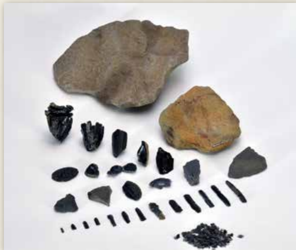
福井洞窟の出土品（土器・石器）

3月19日、国の文化審議会は国指定史跡「福井洞窟」で見つかった出土品 630 点を国重要文化財（美術工芸品）に指定するように文部科学大臣に答申しました。これら出土品は「旧石器時代から縄文時代の石器群の変遷と、縄文土器出現期の様相を知る上で、極めて高い学術的価値がある」と審議会で評価され、本年度の国の告示をもって、正式に国指定重要文化財となる予定です。旧石器時代の出土品としては全国で 11 例目、本市の考古資料が国の重要文化財に指定されるのは平成 8 年の泉福寺洞窟の出土品以来 24 年ぶりとなります。福井洞窟の出土品は来年春オープン予定の福井洞窟ガイダンス施設（仮称）で展示公開します。