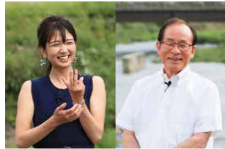
6月放送分の収録の様子

朝長市長が自ら市の施策などをお知らせする広報テレビ番組「させば市政だより～キラっ都させば～」。7月は「させば振興券」でまちに元気と活力を」をテーマにお知らせします。素敵なプレゼントも用意していますので、どうぞご覧ください。