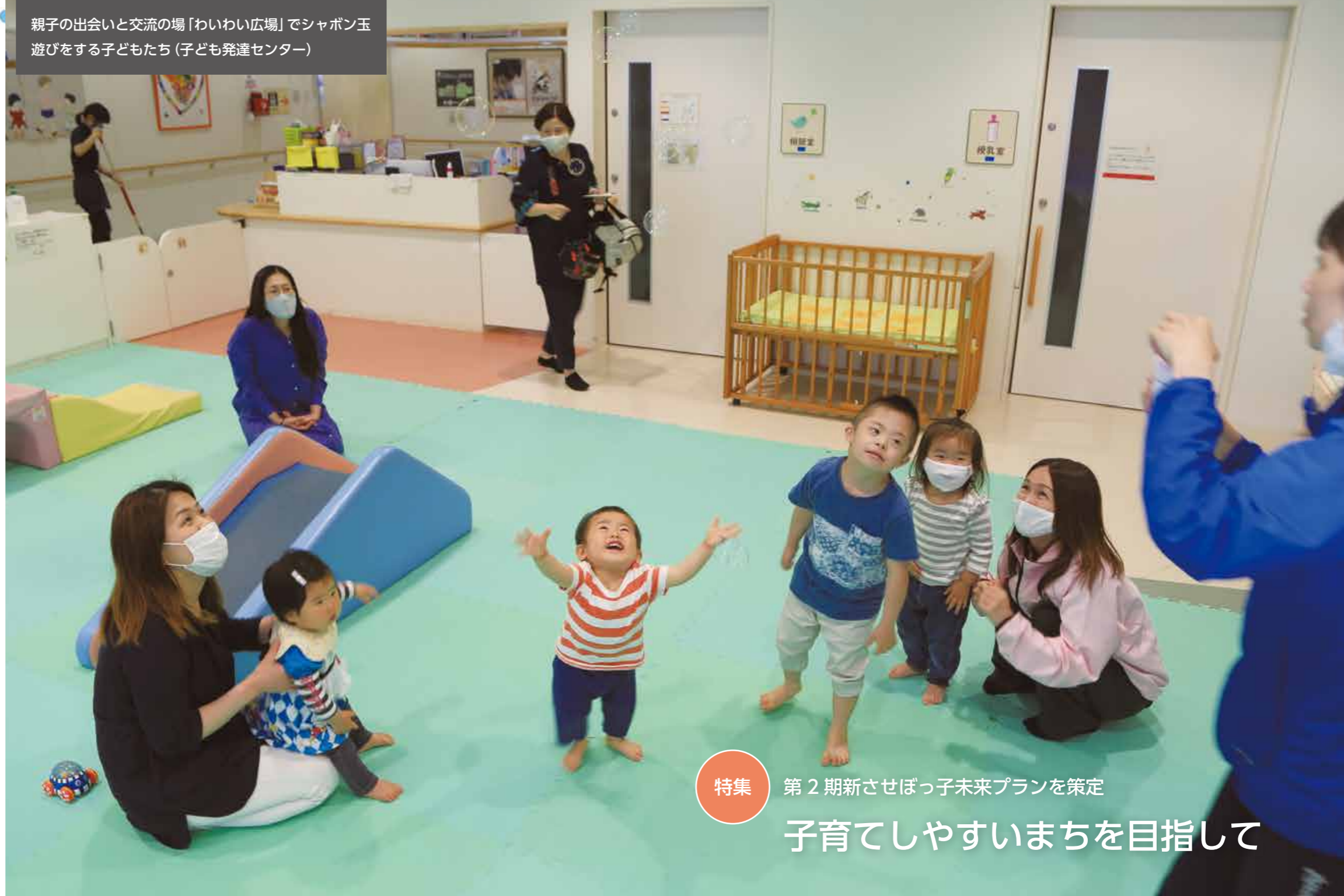
特集 第2期新させぼっ子未来プランを策定 子育てしやすいまちを目指して

本市では、子どもを安心して産み、楽しく育て、子どもが健やかに成長できるまちを目指し、次世代の子どもたちや子育てを支援しています。今回の特集では、本年4月に策定した「第2期新させぼっ子未来プラン」の概要や、身近な地域での子育て支援の取り組みなどについてお知らせします。