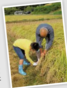
令和元年度に実施した「親子で農業体験」の様子