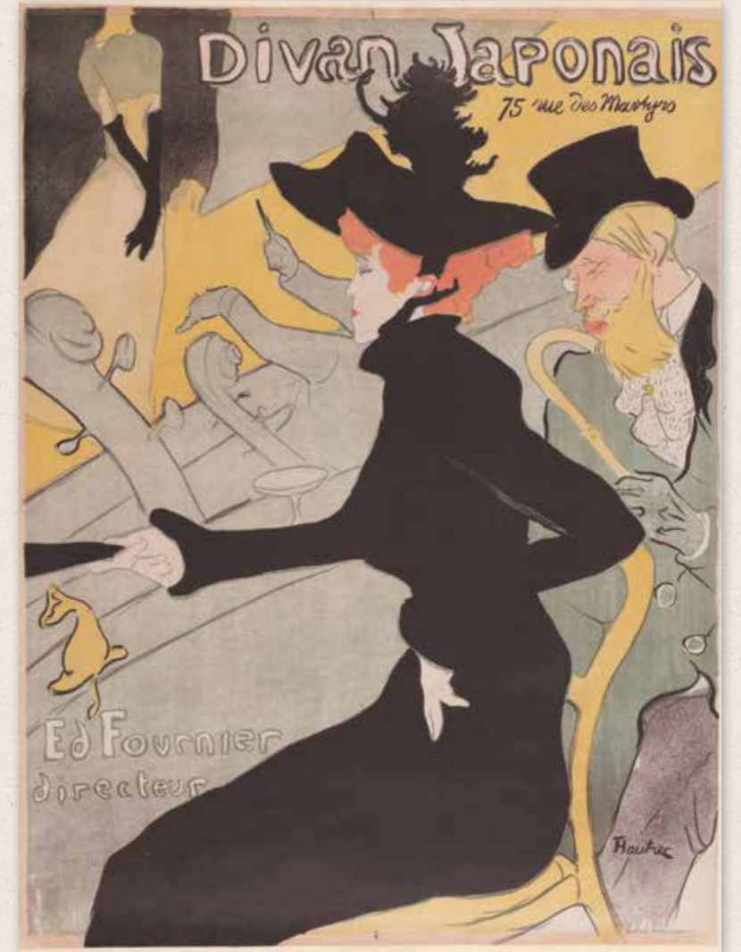
ロートレック《ディヴァン・ジャポネ》

※1回の来館ごとに200円ずつ値引き するリピーター割や、65歳以上の方が 100円引きになる当日シルバー割など各 種割引制度もあります。