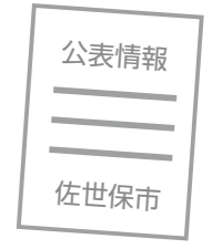
●新型コロナウイルス感染症特別対策室 (情報の公表に関すること) ☎24・11111

感染拡大防止につながる情報については正確に伝えるよう努めておりますので、市民の皆さまには一人一人が冷静な判断と適切な行動を取っていただきますよう、ご理解とご協力をお願いします。