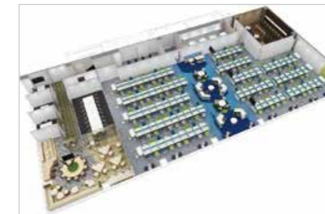
(上)ラクロスビルディングの完成予定図、 (下)同社のオフィスイメージ