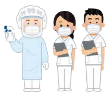
●人権男女共同参画課(人権や誹謗中傷に関すること) ☎24・11111

現在、新型コロナウイルス感染症に感染された患者の方をはじめ、感染リスクを抱えながら命や健康を守るために医療・介護に従事する方、社会経済活動を維持する上で必要不可欠な仕事に従事する方など、多くの方々が感染症と闘っています。感染症には「被害者も「加害者」もなく、これらの方々やその家族に対する差別や偏見、誹謗中傷は決して許されません。公的機関の正しい情報に基づいて冷静な行動に努め、感染症に関わる全ての人を皆さんで応援しましょう。