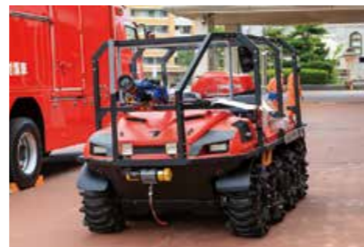
小型水陸両用バギー 泥水でぬかるんだ場所や水上など、あらゆる地形を走行でき、障害物を突破できる。毎分2000ℓ放水可能な放水銃を搭載

また、市が開設する指定避難所だけでなく、自宅で安全が確保できる部屋への避難(自宅避難)や親戚・知人家などへの避難(縁故避難)など、コロナ禍における3密防止を図るため分散避難についても検討しましょう。