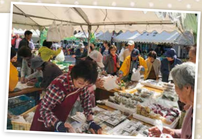
どろんこ収穫祭の様子