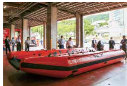
高機能救命ボート 強い耐久性があり、がれきなどがある浸水域で移動できる。最大20人まで乗船でき、大量救出や重量物の搬送ができる

消防局警防課(車両等に関すること) ☎ 23-9255、防災危機管理局(防災に関すること) ☎ 24-1111