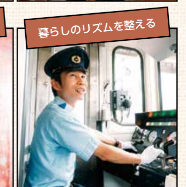
暮らしのリズムを整える