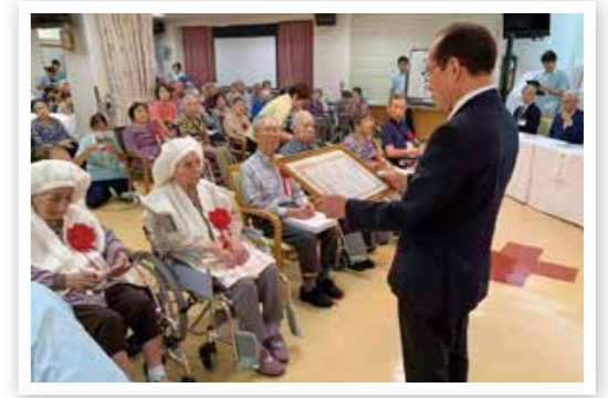
養護老人ホームを訪れ、100歳を迎えられた方に記念品を贈る市長(令和元年9月16日撮影)

ところで、ことし9月1日現在での本市における100歳以上の方は206人(前年同月比+14人)、さらに今年度中に100歳を迎えられる方が84人(+6人)で、合わせると290人(+20人)の方がいらっしゃるそうです。