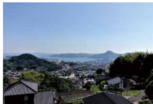
小佐世保町からの眺め

「わたしのお気に入りの眺め」をテーマに、ご自身のFacebookやTwitter、Instagramに「#景観させぼしフォトイベント2020」を付けて佐世保市の風景や景色の写真、動画を投稿してください。応募者の中から抽選で「海上自衛隊カレーセット」を5名様にプレゼントします。詳しくは市HPをご覧ください。