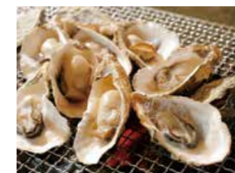
冬におすすめの焼きガキ