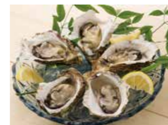
秋におすすめの生カキ

冬の九十九島かきは、殻も身入りもプリプリに成長し、「芳醇」「濃厚」「クリーミー」な味わいが楽しめます。寒い中で食べるアツアツの「焼きガキ」もおおすすめです。