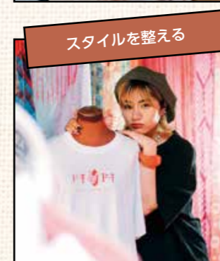
スタイルを整える