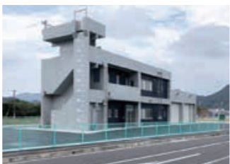
西消防署佐々出張所 新庁舎

【新住所】北松浦郡佐々町小浦免41番地17 ※電話・ファクス番号は変更ありません。 ☎ 消防訓練所 ☎ 23・2538