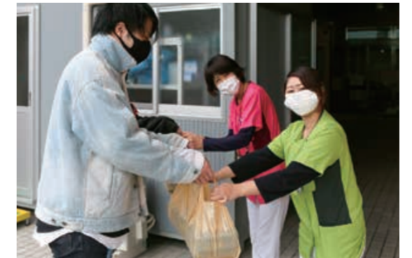
笑顔で弁当を受け取る医療従事者の皆さん

新型コロナウイルス感染症の拡大防止のため、多くの物資などを支援していただき、厚くお礼を申し上げます。また、1月20日(水)からは、感染症医療に従事されている関係者の方々を佐世保の食で応援するため、食事の提供資金を募る寄付金箱を市役所などに設置しており、皆さまから寄付をいただいています。ご支援や寄付にご協力をいただいた皆さまに感謝の意を込め、公表に承諾された方のお名前などを紹介します。