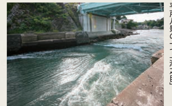
平戸八景の一つ「潮之目」

登録は官報告示をもって正式に決定され、登録されると本市で14件目の国登録有形文化財(建造物)になります。