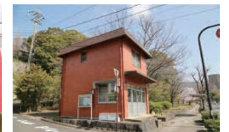
3月26日に中央公園で行われた安全祈願式(左)、安全祈願式での集合写真(中央)、中央公園管理事務所に生まれ変わる建物(右)