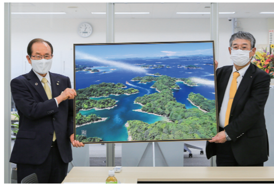
記念品を贈呈し、記念撮影を行う野邊取締役専務執行役員(右)と朝長市長