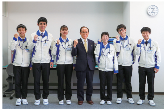
新入社員の皆さんと朝長市長 ※感染症対策を徹底した上で、撮影時だけマスクを外しています。