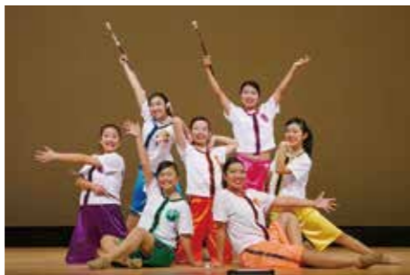
バトントワリングチームの皆さん