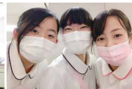
看護専門学校時代の辻さんと同期の皆さん