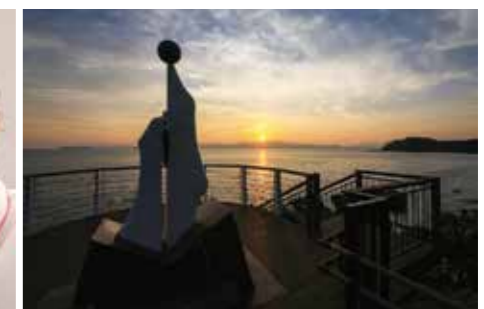
お気に入りの「神崎鼻公園」の夕日