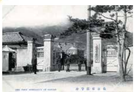
当時の佐世保鎮守府庁表門

それまでの佐世保は、干拓地や湿地が広がる人口4千人ほどの村でしたが、鎮守府の設置によって飛躍的に成長し、明治から大正期にかけては、最先端の技術と最高の人材が投入され、兵器や艦艇を造る