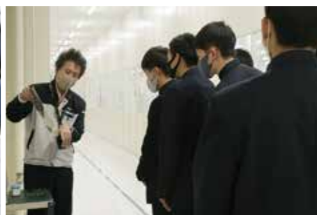
高校生を対象とした工場見学