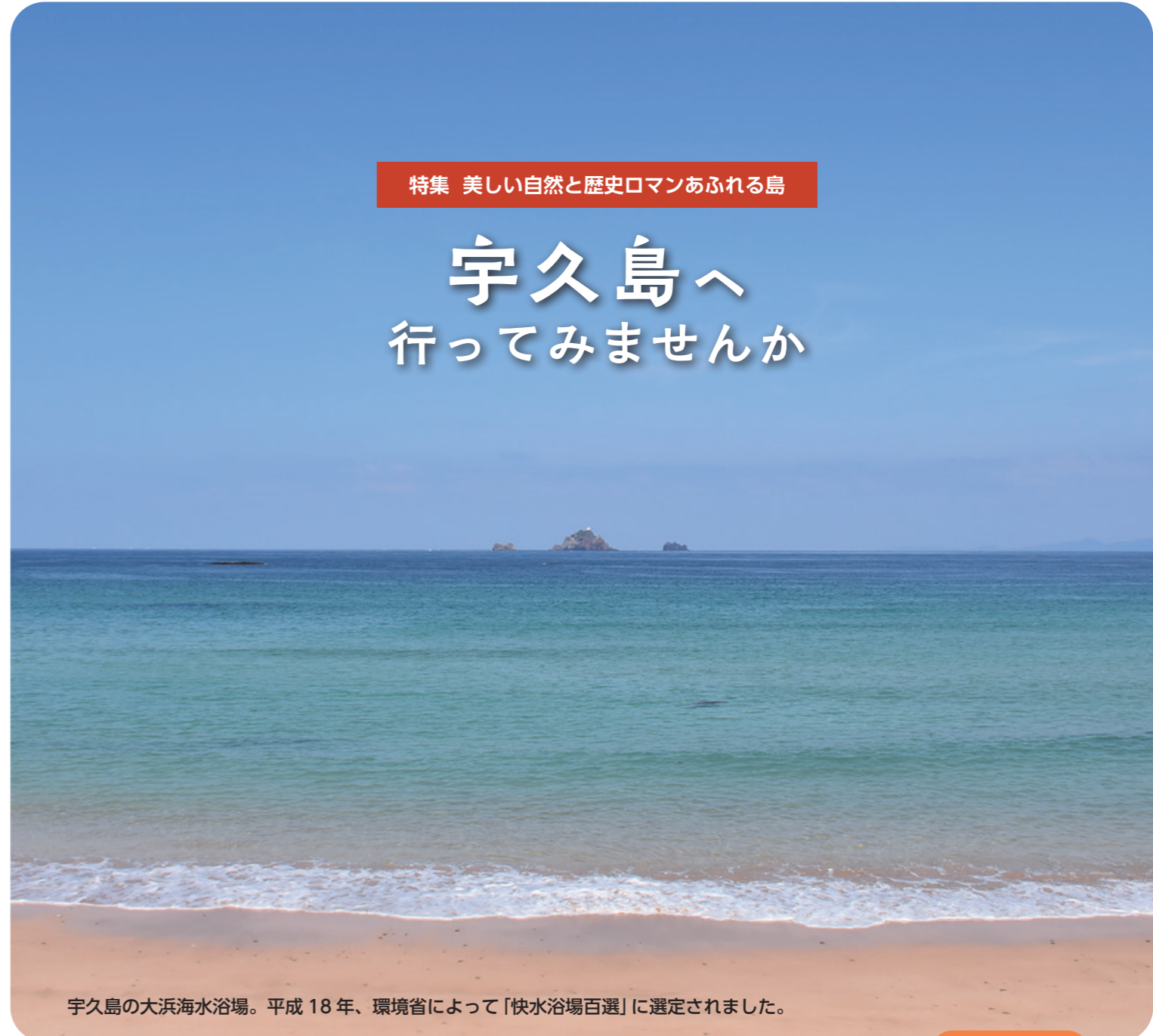
宇久島の大浜海水浴場。平成18年、環境省によって「快水浴場百選」に選定されました。