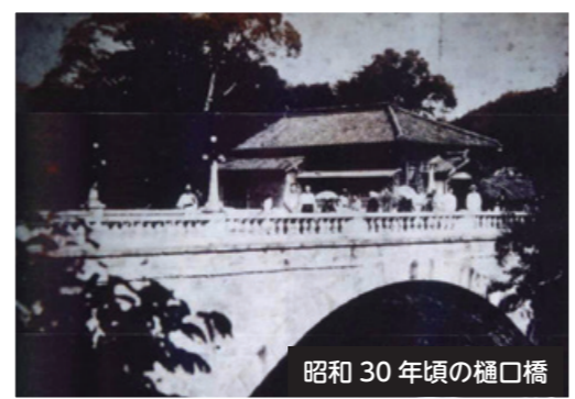
昭和30年頃の樋口橋

「樋口橋」は、大正11(1922)年に架設された石造二連アーチ橋で、ことし架橋100周年を迎えます。佐々川流域に多く残る石橋で唯一の二連アーチ橋であり、最大の石橋でもあります。吉井地区中心部にあり、地区のシンボルとして親しまれ、現在も路線バスが通る堅固な車道として、地域の生活を支える存在です。