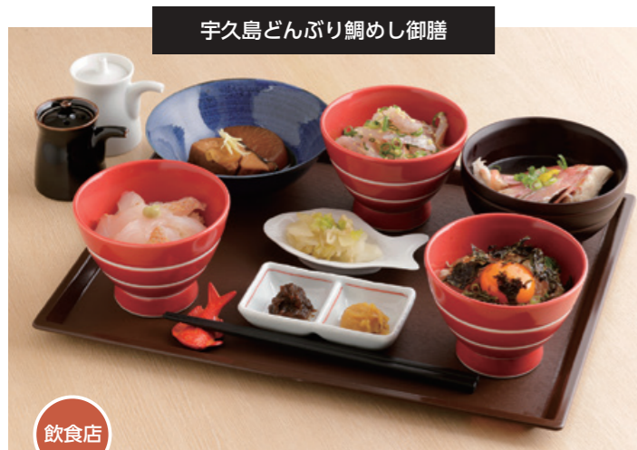
宇久島どんぶり鯛めし御膳