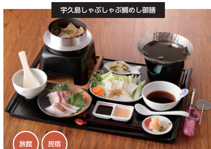
宇久島しゃぶしゃぶ鯛めし御膳