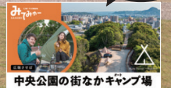
中央公園の街なかキャンプ場