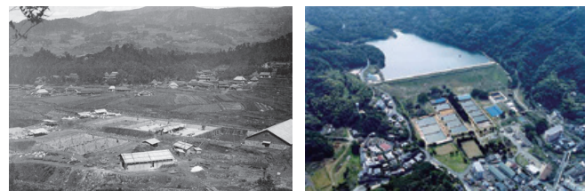
明治40年ごろの山の田貯水池 現在の山の田ダム

水道管による給水が市内で始めて115年経った現在では、ほとんど全ての家に水道が整備され、安心して水が使えるようになりました。