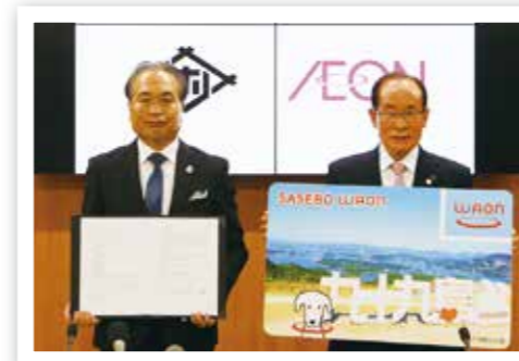
イオン九州株式会社柴田代表取締役社長と朝長市長