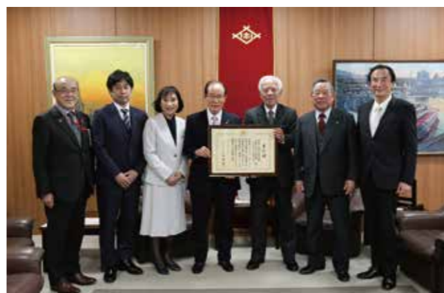
西地区と光海中学校・金比良小学校の取り組みは、学校を核とした地域づくりに効果を上げている取り組みとして「コミュニティ・スクールと地域学校協働活動の一体的推進」に係る文部科学大臣表彰を受賞しました