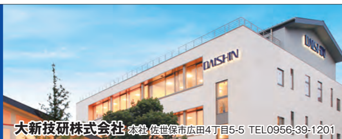
大新技研株式会社 本社 佐世保市広田4丁目5-5 TEL0956-39-1201

1974年に機械設計から始まり、配管設計、CAD/CAMシステム、電子カルテや麻酔記録システムなどの医療系ソフトウェアなど、幅広い分野で専門システムを提供しています。