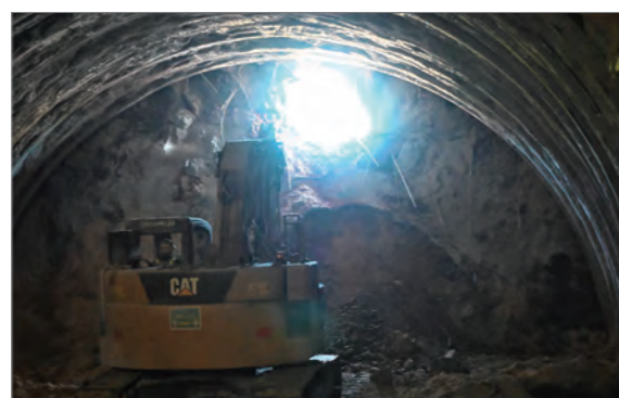
トンネルが貫通した時の様子

☎ NEXCO 西日本佐世保工事事務所 ☎ 59-8777、土木政策課 ☎ 24-1111