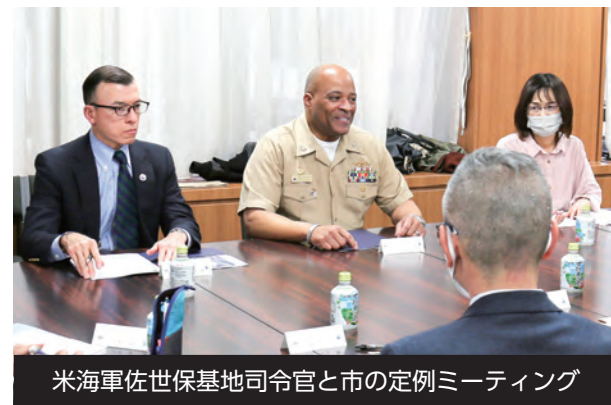
米海軍佐世保基地司令官と市の定例ミーティング