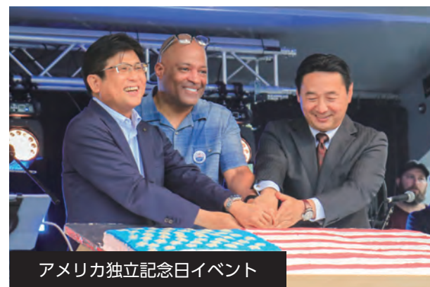
アメリカ独立記念日イベント