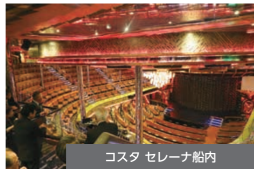
コスタ セレーナ船内