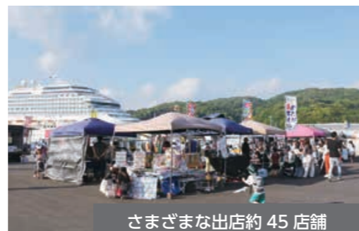
さまざまな出店約45店舗