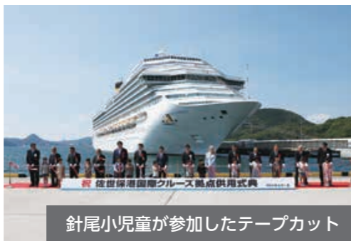
針尾小児童が参加したテープカット