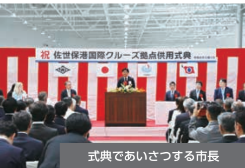
式典であいさつする市長