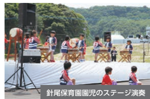
針尾保育園園児のステージ演奏