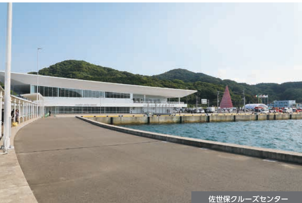
佐世保クルーズセンター

6月1日(土)、針尾北町にある佐世保クルーズセンターがオープンしました。本市は供用開始の式典と、1隻目の寄港となったクルーズ船「コスタ セレーナ」を歓迎するため「クルーズフェスティバル in 浦頭」を開催。式典では針尾小学校の児童が参加したテープカットが行われた他、クルーズセンター横の広場「クルーズフェスティバルビレッジ」では太鼓やよさこい演舞、ジャズ演奏などのステージイベントで来場者を歓迎しました。夜に行われた千灯籠タワーの点灯とクルーズ船の出港、約250発の花火打ち上げの際は、会場全体が歓声に包まれました。