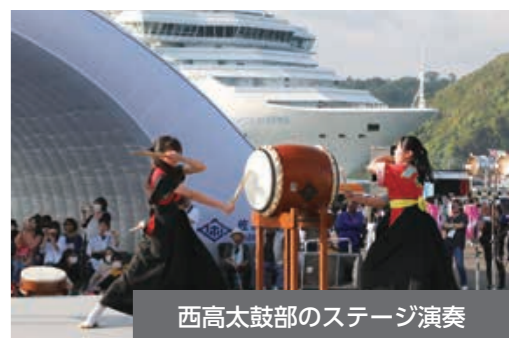
西高太鼓部のステージ演奏