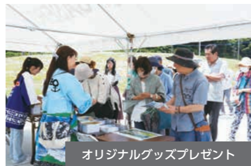
オリジナルグッズプレゼント