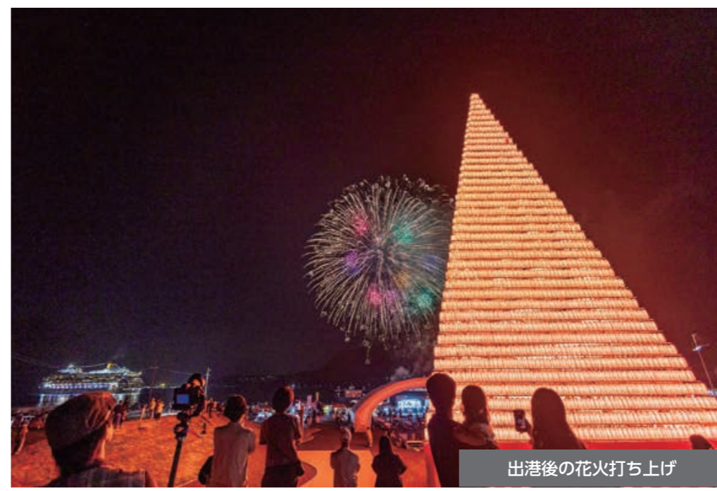
出港後の花火打ち上げ