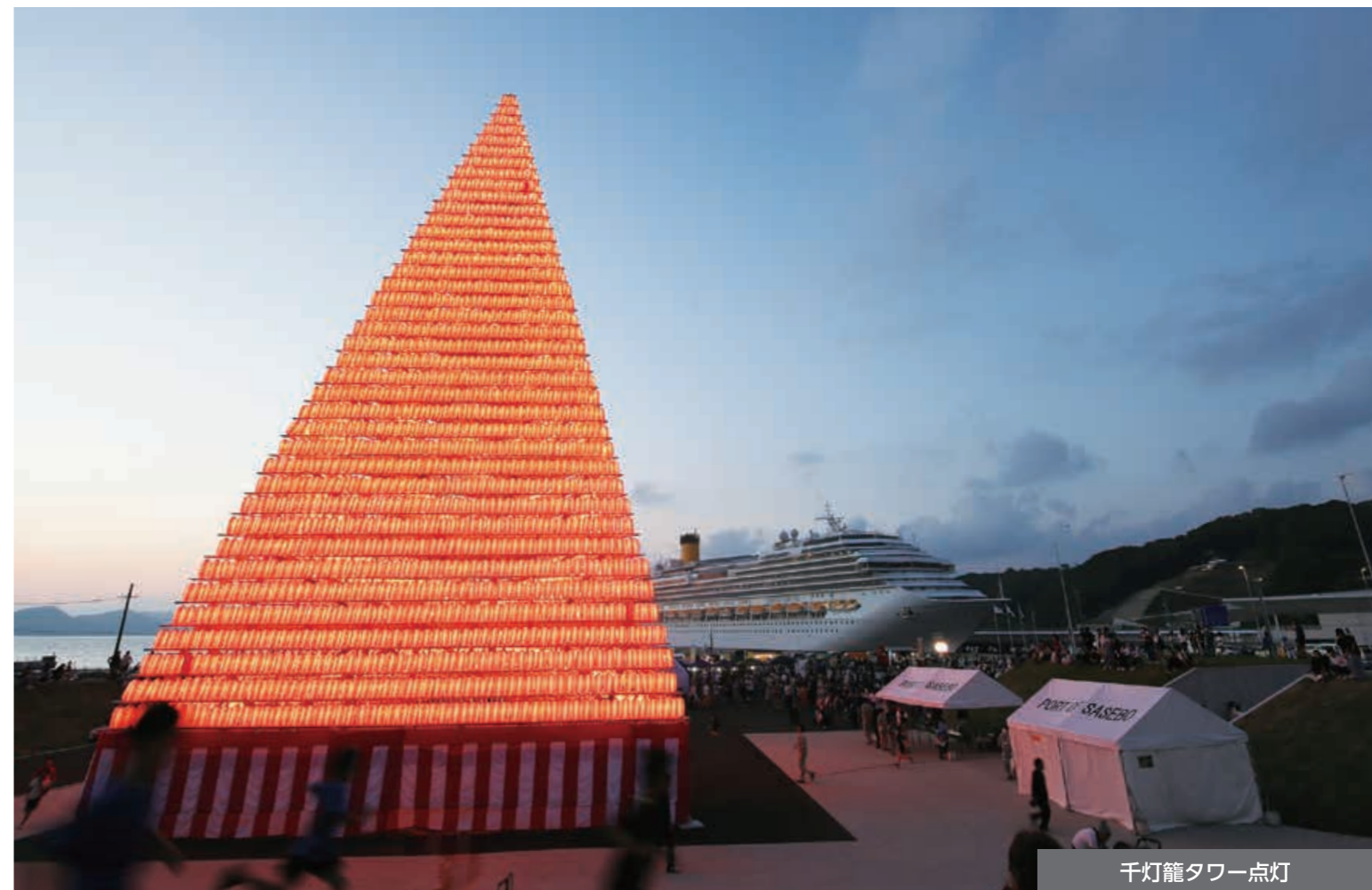
千灯籠タワー点灯