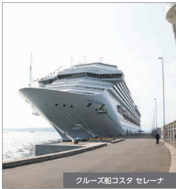
クルーズ船コスタ セレーナ