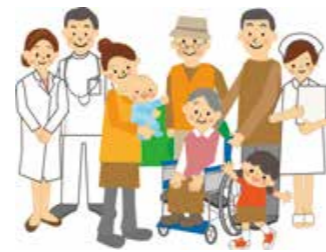
問 健康づくり課(①~⑥) 問 子ども保健課(⑦)

3歳児健診⇒⑪3歳6カ月ごろ ※約1カ月前に該当者に通知。 ※江迎健康館で実施している乳幼児健診は、3月から場所を江迎支所に変更します。