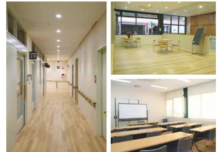
問 保健福祉政策課 ☎24-1111