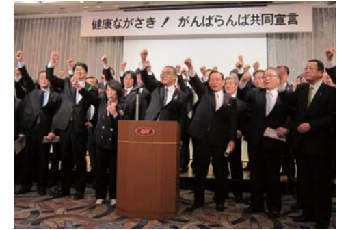
「健康ながさき！がんばらば共同宣言」を行う関係者

4月10日、県知事をはじめとする県内の自治体と医療保険者、県医師会など43団体が一堂に会し、特定健診の受診率向上に一丸となって取り組むことを誓う「健康ながさき！がんばらば共同宣言」を行いました。県を挙げたこのような取り組みは全国初の試みであり、今後は県民の健康増進に向けて、より一層活動を進めていきますので、皆様のご理解とご協力をお願いします。