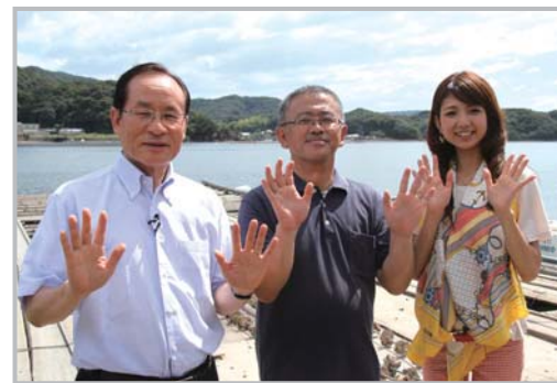
「佐世保の新しい夏の味覚！九十九島岩がき」(8月放送)の収録の様子。市ホームページで閲覧できます。

10月25日（木）から5日間、ハウステンボスをメイン会場に開催される「和牛の祭典 in ながさき」。開催目前に迫ったこのイベントを朝長市長が紹介します。