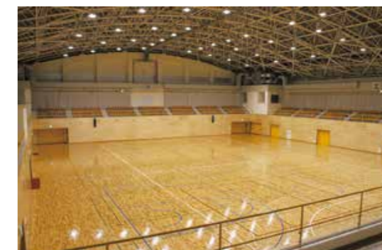
東部スポーツ広場体育館の内部

※3月14日④に抽選結果を発表。以降は東部スポーツ広場での一般利用受け付けが可能になります。