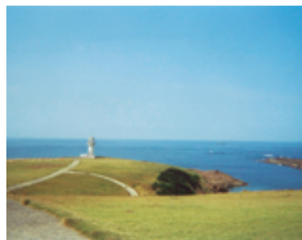
対馬瀬 コマーシャルの撮影にも使われた場所で、釣りのポイントとしても愛好家に人気があります。