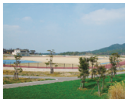
総合運動公園 陸上競技場と野球場を完備し、合宿で社会人や学生などに幅広く利用されています。