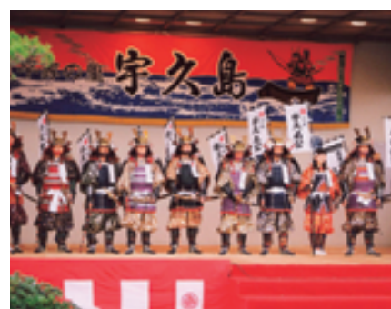
平家まつり 平家盛の上陸再現や武者行列などが繰り広げられる一大イベントです（11月中旬ごろ開催）。