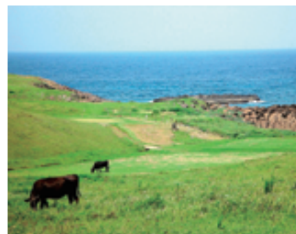
和牛 島には牧草が広がり、あちらこちらで放牧された牛を見ることができます。