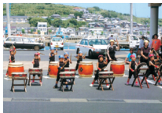
太鼓を演奏する宇久幼稚園の園児たち

平家まつりや夏の納涼大会などのまちのイベントには、園児が太鼓演奏などで参加しています。わたしもイベントの計画の段階からスタッフとして携わり、カメラ撮影や音響など裏方として楽しみながら参加しています。イベントを盛り上げていくためには、まず自分が楽しむことが大切だと思います。まちには、このほかいくつかの太鼓グループがありますが、合併記念式典では高校生のグループが演奏します。年々子どもたちも減ってメンバーを確保するのも難しくなっていますが、このような活動が続くよう支えていきたいと思っています。今後も、これまで開催してきたイベントを継続していき、まちの人たちに活気を与えていきたいと思っています。