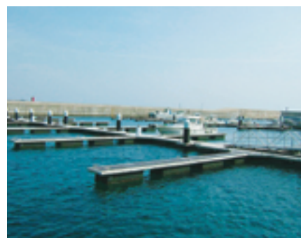
フィッシャリーナ宇久 東シナ海へのクルージングの拠点となる、ヨットなどの「海の駅」です。