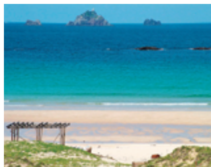
大浜海水浴場 きれいな海と遠浅の白い砂浜が広がる海水浴場で、すぐ近くにはキャンプ場もあります。