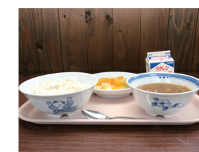
唐子と市木ハナミズキの花が手描きされた食器