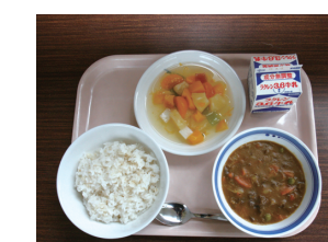
9月1日の三川内中の献立