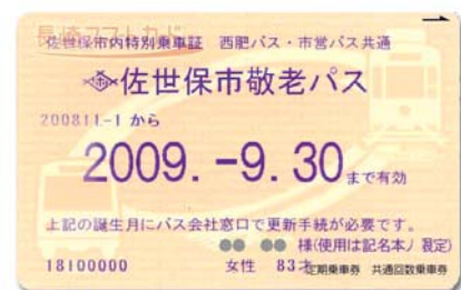
ICカードパス券の見本 (誕生日が9月の場合)