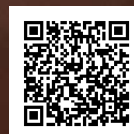
携帯電話版はこちら

市ホームページアドレス http://www.city.sasebo.nagasaki.jp/